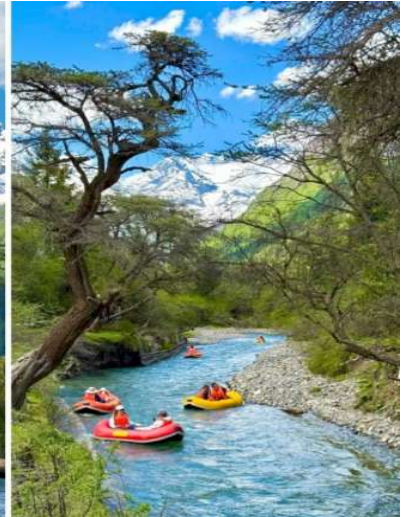
ล่องเรือยาง เหนียนฮอว์ป้า (Nian Yu Ba)

*ขอสงวนสิทธิ์ในการคืนค่าล่องเรือในกรณีที่ท่านไม่ใช้บริการ **