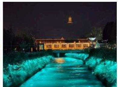
เขื่อนตู่เจียงเยี่ยน

ที่พัก LIWAN HOLIDAY HOTEL DUJIANGYAN หรือเทียบเท่า 4 ดาวจีน