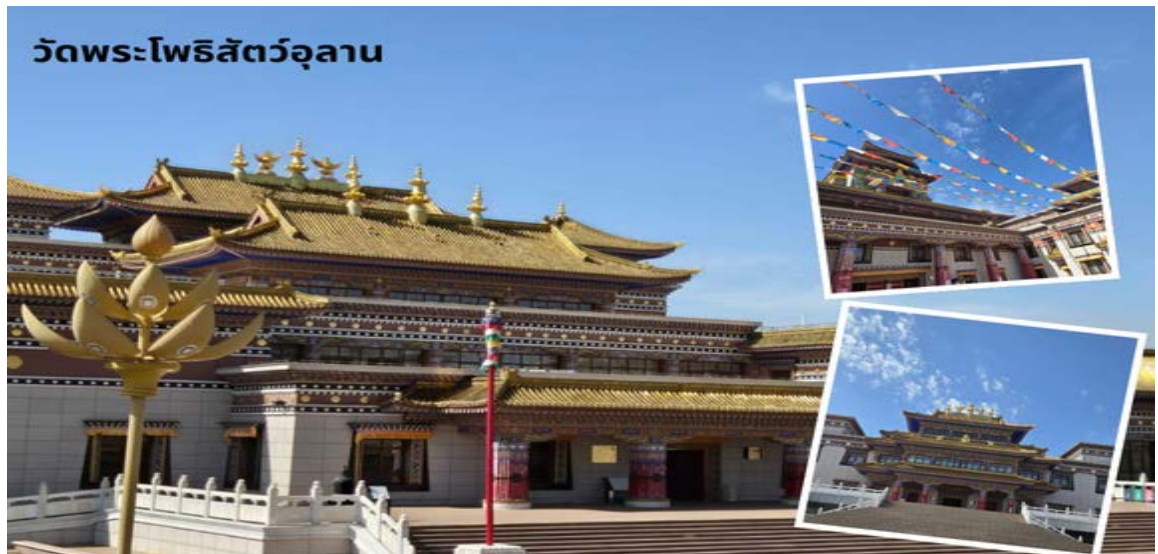
วัดพระโพธิสัตว์อูลาน

นำท่านสู่ วัดพระโพธิสัตว์อูลาน เป็นสถานที่ท่องเที่ยวระดับ 4A ครอบคลุมพื้นที่ประมาณ 20,000 ตารางเมตร รูปแบบอาคารเป็นสถาปัตยกรรมแบบผสมผสานมองโกล ทิเบต และฮั่น ภายในมีการจัดแสดงโบราณวัตถุทางวัฒนธรรมที่ยังคงมีความสมบูรณ์