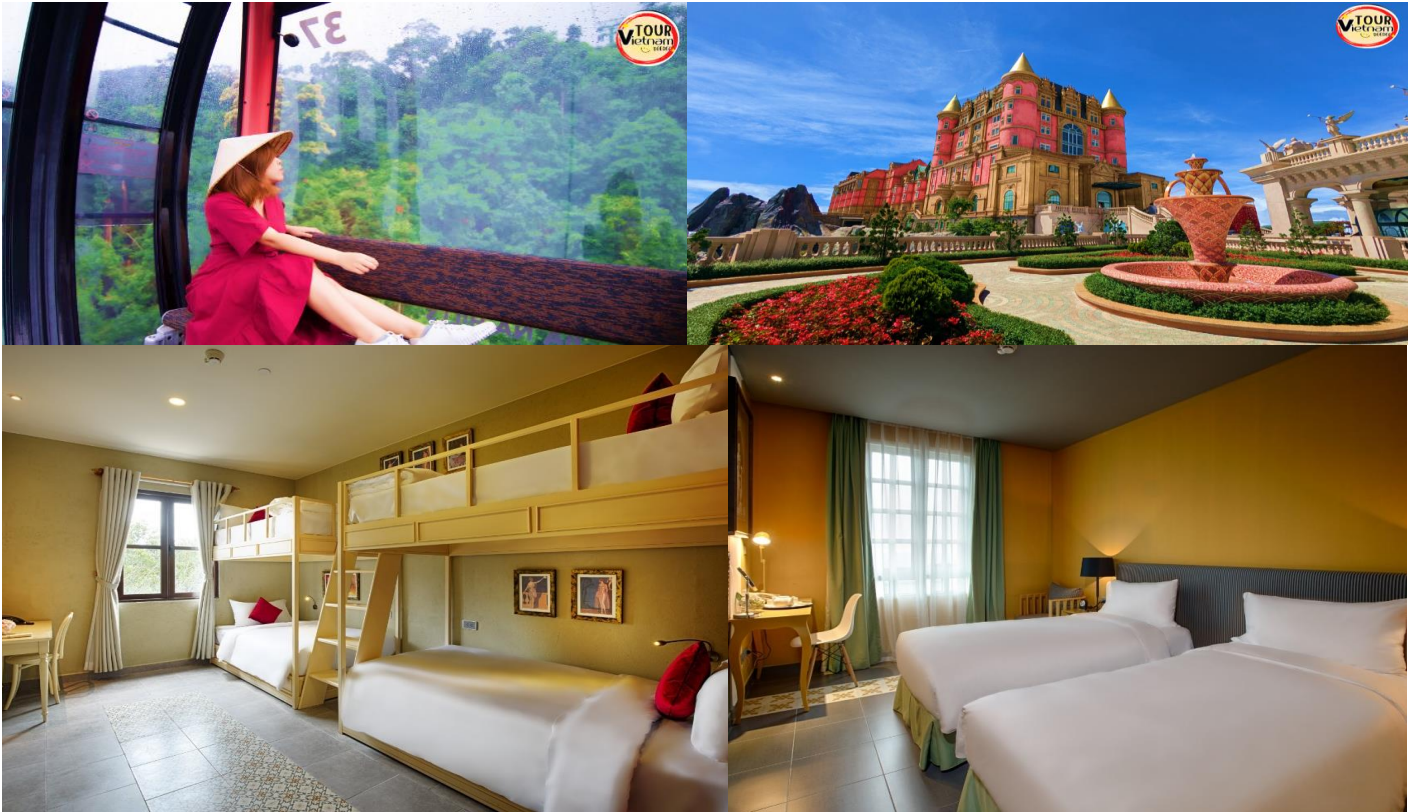
☞ นำท่านเข้าสู่ที่พัก Mercure Ba Na Hill ระดับ 4 ดาว หรือเทียบเท่า (บานาฮิลล์)