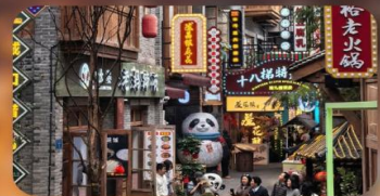
หมู่บ้านสี่ป่าที่