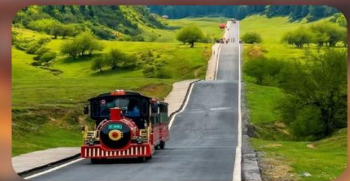
หุบเจานางฟ้า