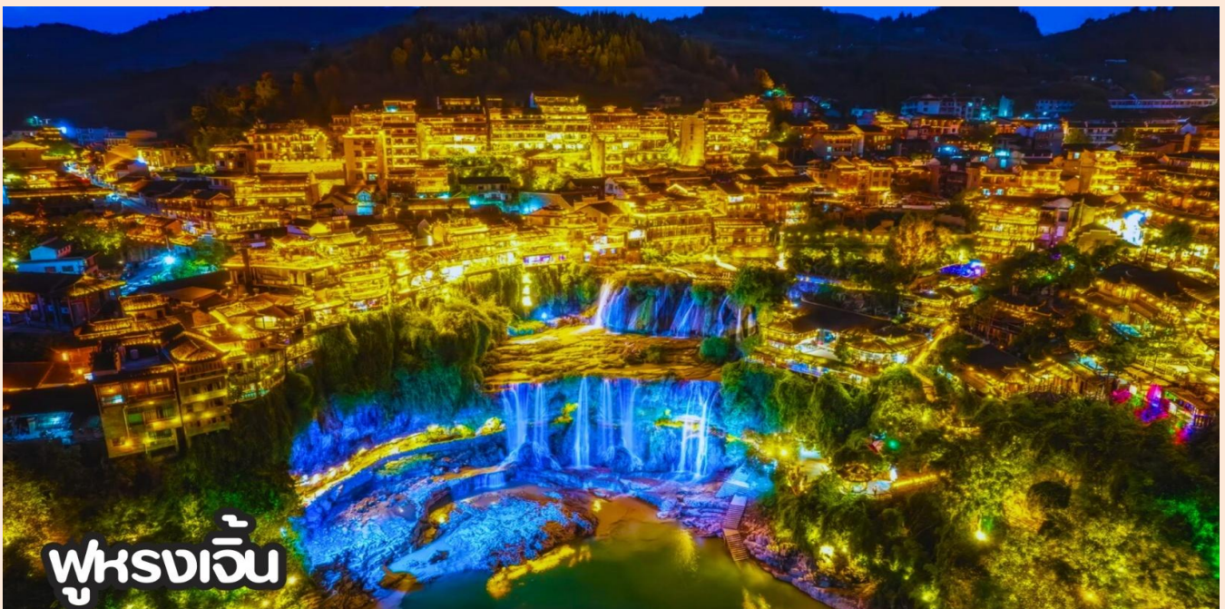
ฟูรงเจิน

เดินทางสู่ เมืองโบราณฟูรงเจิน (Furong Zhen) หรือ "หมู่บ้านเหนือน้ำตก" เป็นเมืองเก่าแก่อายุกว่า 2,000 ปีของชาวเผ่าจิวอี้ ตั้งอยู่ในมณฑลหูหนาน จุดเด่นที่เป็นภาพจำระดับโลกคือ น้ำตกขนาดใหญ่ ที่ไหลผ่านใจกลางหมู่บ้านลงสู่แม่น้ำโหย่วฉู่ ทำให้ดูเหมือนตัวหมู่บ้านตั้งอยู่บนหน้าผาเหนือน้ำตก เดิมเมืองนี้มีชื่อว่า "หวังซุน" แต่ได้เปลี่ยนชื่อเป็นฟูรง ชมน้ำตกฟูรง ถือเป็นไฮไลท์ที่สวยงามที่สุดของเมืองโบราณแห่งนี้