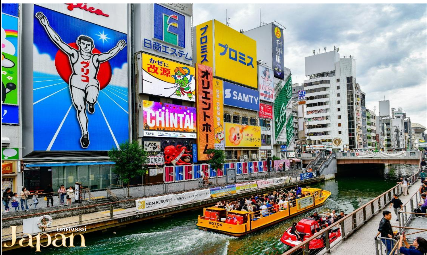
บัททงซซึ Japan

เดินทางสู่ ชินไซบาชิ เป็นย่านช้อปปิ้งแห่งโอซาก้า ตั้งอยู่ใกล้กับนัมบะและโดทงโบริ เป็นย่านช้อปปิ้งที่มีความยาวราว 2 กิโลเมตร ย่านนี้ประกอบไปด้วยร้านค้า ร้านอาหาร คาเฟ่ ร้านเครื่องสำอาง ร้าน 100 เยน ร้านยา ร้านปลอดภาษี ร้านแบรนด์เนม ไฮเอนและห้างดังต่างๆมากมาย จุดเริ่มต้นของย่านนี้จะอยู่ที่สะพานเอบิชิ ที่อยู่ตรงกลางโดทงโบริ พาท่านเช็คอินถ่ายรูปกับจุดยอดฮิต “ป้ายกูลิโกะ”