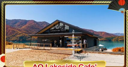
AO Lakeside Cafe'