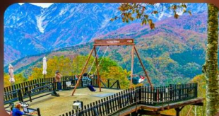
ฮาคุบะ-อิวาทากะ