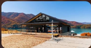
AO Lakeside Cafe'

HOTEL NARITA AREA หรือเทียบเท่ามาตรฐานญี่ปุ่น