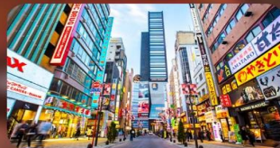
ซัปป์ิงชินจูกุ