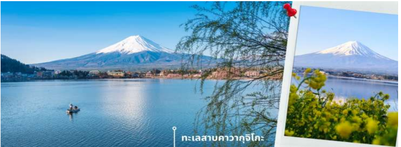
*ดอกไม้จะปรับเปลี่ยนตามฤดูกาล // การมองเห็นภูเขาไฟฟูจิขึ้นอยู่กับสภาพอากาศ*

หลังรับประทานอาหารเที่ยง นำท่านเดินทางสู่ ทะเลสาบคาวากูจิโกะ (Lake Kawaguchiko) ในจังหวัดยามานาชิ แหล่งท่องเที่ยวที่อยู่ไม่ไกลจากโตเกียว (Tokyo) หนึ่งในที่เที่ยวยอดนิยมยอดฮิตตลอดกาล ทะเลสาบที่กว้างใหญ่เป็นอันดับ 2 ของ 5 ทะเลสาบรอบภูเขาไฟฟูจิ อยู่บริเวณเชิงภูเขาไฟ ความสูงกว่าระดับน้ำทะเลประมาณ 800 เมตร ทำให้สภาพอากาศบริเวณนี้เย็นสบายตลอดปี ร่ายล้อมไปด้วยธรรมชาติที่อุดมสมบูรณ์ และทิวทัศน์สวยงามตลอดปี สามารถชมวิวดูทั้งทะเลสาบและภูเขาไฟฟูจิได้อย่างชัดเจนในวันที่ฟ้าเปิด จากนั้นเดินทางต่อไปยัง สวนโออิชิ พาร์ค (Oishi Park) เป็นสวนสาธารณะริมทะเลสาบคาวากูจิโกะ เป็นจุดชมวิวยอดนิยมที่ได้รับความนิยมอย่างมาก เป็นจุดชมดอกไม้ที่ปรับเปลี่ยนไปตามฤดูกาล สายพันธุ์และทัศนียภาพอันสวยงามตัดกับภูเขาไฟฟูจิที่ตั้งตระหง่านอยู่เบื้องหลัง ในวันที่ฟ้าเปิด ยังเป็นจุดชมวิวก่อนที่สามารรถเห็นวิวภูเขาไฟฟูจิได้ ให้ท่านได้เก็บภาพความสวยงามตามอัธยาศัย