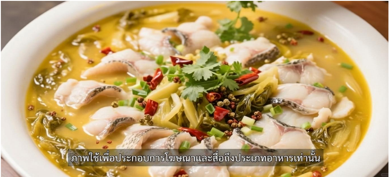
ภาพใช้เพื่อประกอบการโฆษณาและสื่อถึงประเภทอาหารเท่านั้น

เมนูเด็ดที่กำลังเป็นกระแสไวรัลและถูกเหล่านักชิมตลอดจนบล็อกเกอร์สายกิน รีวิวตามรอยกันอย่างล้นหลาม งานศิลปะแห่งรสชาติที่ผสมผสานความจัดจ้านได้อย่างลงตัว น้ำซุปลีทองสุดเข้มข้น หัวใจหลักของค็อร์ส "เปรี้ยว" นำที่ได้จากผักกาดดอง ซึ่งผ่านการหมักบ่มตามธรรมชาติจนเกิดกรดแลคติกที่ให้รสเปรี้ยวกลมกล่อม ช่วยเปิดต่อมรับรสและเรียกน้ำย่อยได้ดีเยี่ยม ผสานเข้ากับความ "เผ็ดชา" จากพริกแห้งและพริกไทยเสฉวน ชดแล้วตาสว่าง สดชื่น โล่งคอ