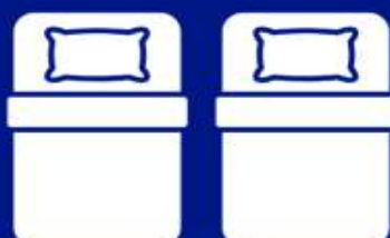
ห้องพักเตียงคู่ TWIN BED ROOM (TWN)

ห้องพักสำหรับ 1 ท่าน มีค่าใช้จ่ายเพิ่มจากค่าหัววีร์