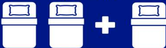
ห้องพักสำหรับสามท่าน (ที่นอนเสริม) TRIPLE BED ROOM (TRP)