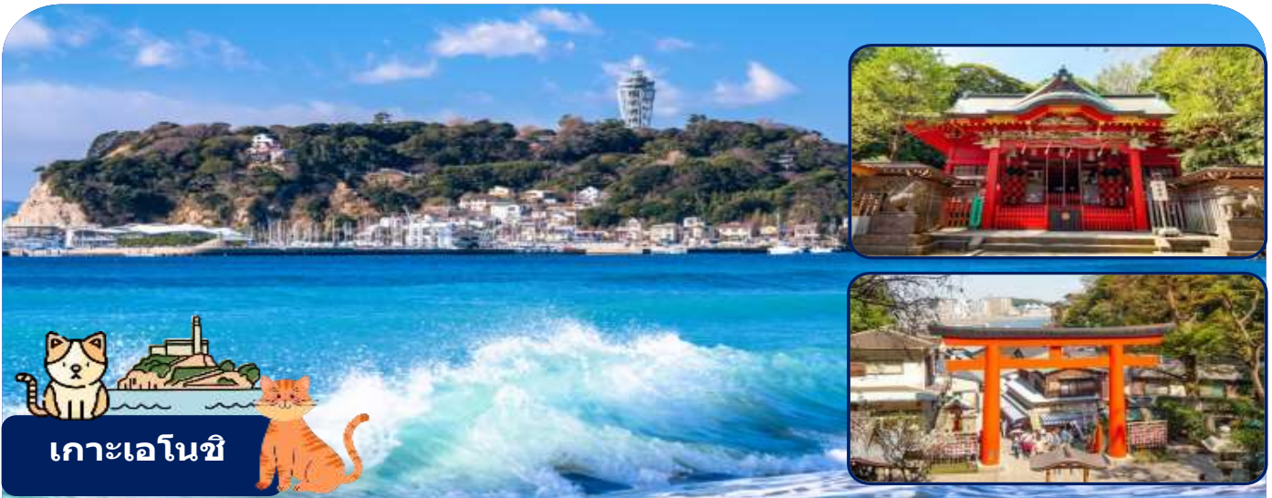
เกาะเอโนชิ

นำท่านเดินทางสู่เมืองคามาคุระ จังหวัดคางาวะ เมืองประวัติศาสตร์ที่ขึ้นชื่อเรื่องวัดวาอารามและวิวทะเลสดโรแมนติก ให้ท่านได้สัมผัสกลิ่นอายญี่ปุ่นแบบดั้งเดิมผสมผสานกับความสงบของธรรมชาติ