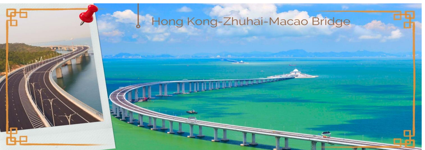
CHXH9 ฮองกง-มาเก๊าเดย์ทัวร์ เที่ยวจุใจ 4วัน2คืน สายการบิน Hongkong Airlines (Jun-Oct' 26)

02.40 น. นำท่านเดินทางสู่ ฮองกง โดยสายการบิน HONG KONG AIRLINES (HX) เที่ยวบินที่ HX768 07.00 น. เดินทางถึงสนามบินเซ็กเล้งก๊อก เขตปกครองพิเศษฮองกง นำทุกท่านเข้าพิธีการตรวจคนเข้าเมืองหลังจากผ่านพิธีการตรวจคนเข้าเมืองเป็นที่เรียบร้อยแล้ว รับกระเป๋าสัมภาระ และเดินทางโดยรถโค้ชปรับอากาศ **โปรดทราบ เวลาท้องถิ่นที่ฮองกงเร็วกว่าประเทศไทย 1 ชั่วโมง กรุณาปรับนาฬิกาให้ตรงกับเวลาท้องถิ่น เพื่อความสะดวกในการนัดเวลานะคะ** อธิระให้ท่านแวะทำธุระส่วนตัวตามอัธยาศัย หลังจากทำธุระส่วนตัวเป็นที่เรียบร้อยแล้ว นำกระเป๋าสัมภาระส่วนตัว และเดินทางโดยรถโค้ชปรับอากาศ (สัมภาระฝากไว้ที่รถ) นำท่านเดินทางสู่ มาเก๊า (MACAU) หรือ เอ้าเหมิน (รถโค้ชปรับอากาศ) ด้วยการเดินทางผ่านเส้นทางสะพาน Hong kong – Zhuhai – Macao Bridge สะพานมีความยาว 55 กิโลเมตร ซึ่งเป็นสะพานข้ามทะเลที่ยาวที่สุดในโลก สะพานดังกล่าวเปิดใช้งาน เมื่อวันที่ 23 ต.ค. 2561 ซึ่งเชื่อมระหว่างเขตบริหารพิเศษฮองกง กับเมืองจูไห่ของมณฑลกวางตุ้ง และเขตบริหารพิเศษมาเก๊าของจีน โดยสะพานเส้นทางนี้นับเป็นครั้งแรก ที่จะช่วยลดระยะเวลาการเดินทางจากฮองกงไปยังจูไห่และมาเก๊า จากเดิม 3 ชั่วโมง ให้เหลือเพียงภายใน 1 ชั่วโมง มาเก๊า มีชื่อทางการว่า เขตบริหารพิเศษมาเก๊าแห่งสาธารณรัฐประชาชนจีน เป็นพื้นที่บนชายฝั่งทางใต้ของประเทศจีน เป็นเขตปกครองพิเศษของจีน โดยมีฐานะเป็น เขตบริหารพิเศษภายใต้หลักการ หนึ่งประเทศสองระบบ ผู้ที่อาศัยอยู่ในมาเก๊าส่วนใหญ่พูดภาษากวางตุ้งเป็นภาษาแม่ ภาษาจีนกลาง ภาษาโปรตุเกส และภาษาอังกฤษ ชาวมาเก๊า มี