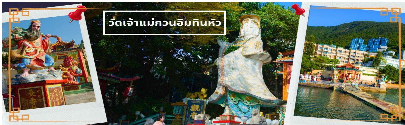
วัดเจ้าแม่กวนอิมหินหัว

เช้า ❗ บริการอาหารเช้า ณ ภัตตาคาร **เมนูติ่มซำต้นตำหรับฮ่องกง** (3) จากนั้นนำท่านเดินทางสู่ วัดเจ้าแม่กวนอิมหินหัว อ่าวรีพลัสเบย์ (TIN HAU TEMPLE REPULSE BAY) ตั้งอยู่ริมทะเล เป็นสถานที่ท่องเที่ยวสำคัญ สร้างขึ้นในปี ค.ศ.1993 วัดแห่งนี้ถูกสร้างขึ้นเพื่อคุ้มครองชาวประมงในการออกเรือไปหาปลา ซึ่งเป็นหนึ่งในวัดที่เก่าแก่ที่สุดของฮ่องกง บริเวณวัดจะมี เจ้าแม่กวนอิมองค์ใหญ่ ประดิษฐานพระพุทธรูปตั้งอยู่เป็นเทพที่ชาวฮ่องกงและคนจีนให้ความเคารพนับถือมากที่สุด สามารถขอพรได้ทุกเรื่อง วัดนี้เป็นที่นิยมมีนักท่องเที่ยวเดินทางมาขอพรกันมากมาย เพราะเชื่อในความศักดิ์สิทธิ์ และยังมีเจ้าแม่ทับทิม หรือเทพิตาแห่งท้องทะเลองค์ใหญ่ ซึ่งคนฮ่องกง คนมาเก๊า และคนจีน ที่อยู่ริมทะเล ชาวประมง นักเดินเรือหรือผู้ที่เดินทางทางเรือเป็นประจำ จะนับถือ