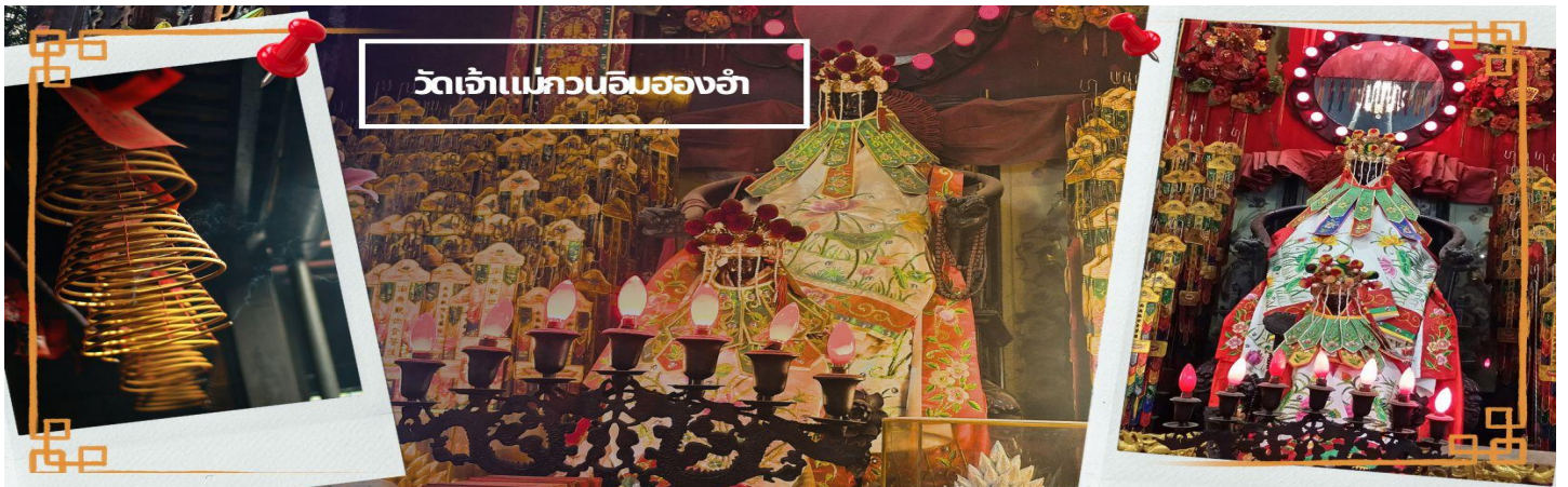
วัดเจ้าแม่กวนอิมฮองฮำ

จากนั้นนำทุกท่านเดินทางสู่ วัดเจ้าแม่กวนอิมฮองฮำ (HUNG HOM KWUN YUM TEMPLE) เป็นหนึ่งในวัดที่ชาวฮ่องกงนั้นเลื่อมใสศรัทธามาก ด้วยความที่เจ้าแม่กวนอิมนั้นเป็นเทพเจ้าแห่งความเมตตา ฉะนั้นเมื่อใครมีทุกข์ร้อนอะไรก็มักจะมากกราบไหว้ขอพรให้เจ้าแม่ช่วยเหลือ วัดนี้ถูกสร้างขึ้นในปี ค.ศ. 1873 ในช่วงสงครามโลกครั้งที่ 2 มีการปล่อยระเบิดลงบริเวณวัดฮองฮำหลายต่อหลายครั้ง ทำให้มีผู้บาดเจ็บและล้มตายมากมาย แต่ชาวบ้านที่หนีเข้าไปหลบภัยในวัดนี้ก็กลับปลอดภัยและตัววัดก็ไม่ได้รับความเสียหายจากเหตุการณ์ที่ระเบิดอย่างน่าอัศจรรย์ และวันสำคัญอีกวันหนึ่งที่คนฮ่องกงมาไหว้ขอพรอย่างไม่ขาดสาย และรอยยิ้มเป็นประจำทุกปี ก็คือ "วันเปิดทรัพย์" หรือ วันยิ้มเงินเทพเจ้า เป็นวันที่จะมาขอพรและยิ้มเงินเจ้าแม่กวนอิม ซึ่งตรงกับวันที่ 26 นับจากวันตรุษจีน ซึ่งพิธีนี้ใน 1 ปี มีเพียงครั้งเดียวเท่านั้น