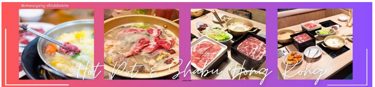
Hot Pot & Shabu Hong Kong

🕒 บริการอาหารกลางวัน ณ ภัตตาคาร พิเศษเมนูชาบู สไตส์ฮ่องกง (5)