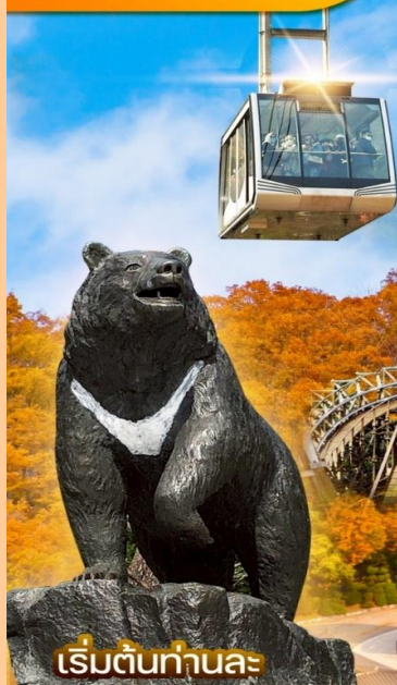
เริ่มต้นท่าละ