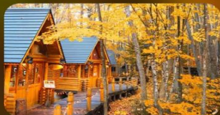
หมู่บ้านนิงเก็ลทอเรซ