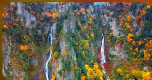
น้ำตกกุงกะ และน้ำตกริวเซ