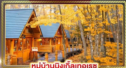
หมู่บ้านนิงเกิ้ลทอเรซ