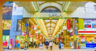
ช้อปปิ้งถนนทากุคิโคจิ