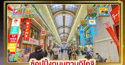
ช้อปปิ้งถนนทานุกิโคจิ