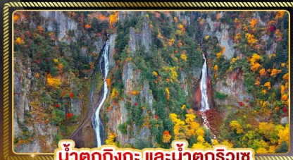
น้ำตกทิงกะ และน้ำตกริวเซ