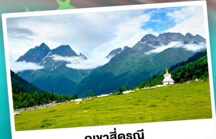
ภูเขาสิ่ดรุณี

ชมความสวยงามทุ่งหญ้าท่ามกลางเทือกภูเขาสิ่ดรุณี อุทยานย่าตัง "แซงกรี่ล่าแห่งสุดท้าย" ระดับ 5A