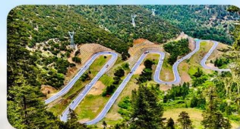
ถนน 18 โค้ง