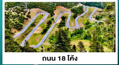
ถนน 18 โค้ง