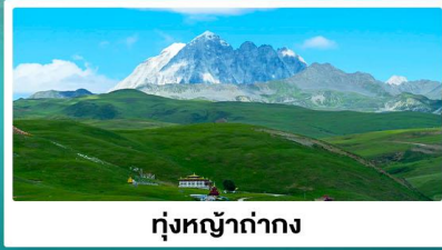
ทุ่งหญ้าท่ามกลาง