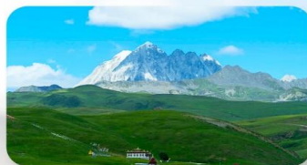
ทุ่งหญ้าด่าง