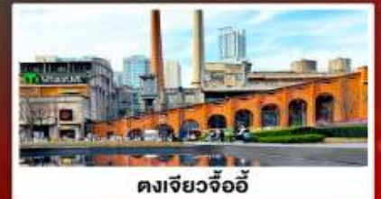
ตงเจียวจื่ออี้