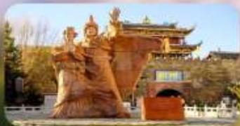
เมืองโบราณซงฟาน