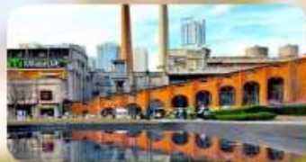
ตงเจียวจื่ออี้