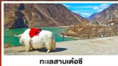
ทะเลสาบเค่อซี