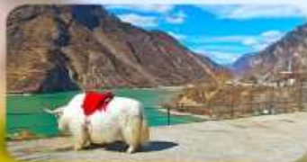
กะเลสาบเค่อซี