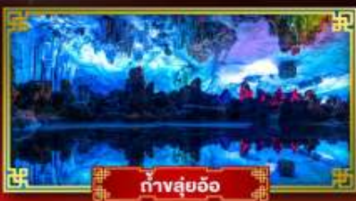
ถ้ำลุย้อ

"ดินแดนแห่งสายน้ำและภูเขา" สัมผัสประสบการณ์นั่งบอลลูนชมวิวมุมสูง