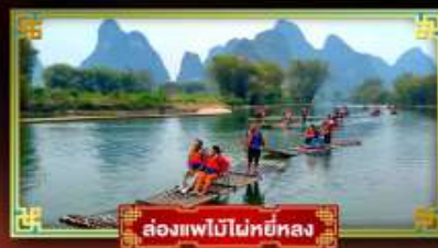
ล่องแพไม้ไผ่หยางซิว