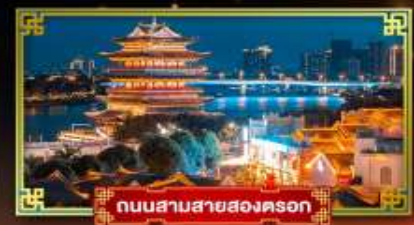
ถนนสามสายสองตอรอก