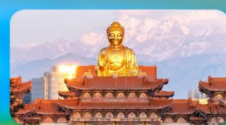
วัดพระใหญ่หวงกงชาน