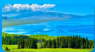
ทะเลสาบไซไห่หลู่