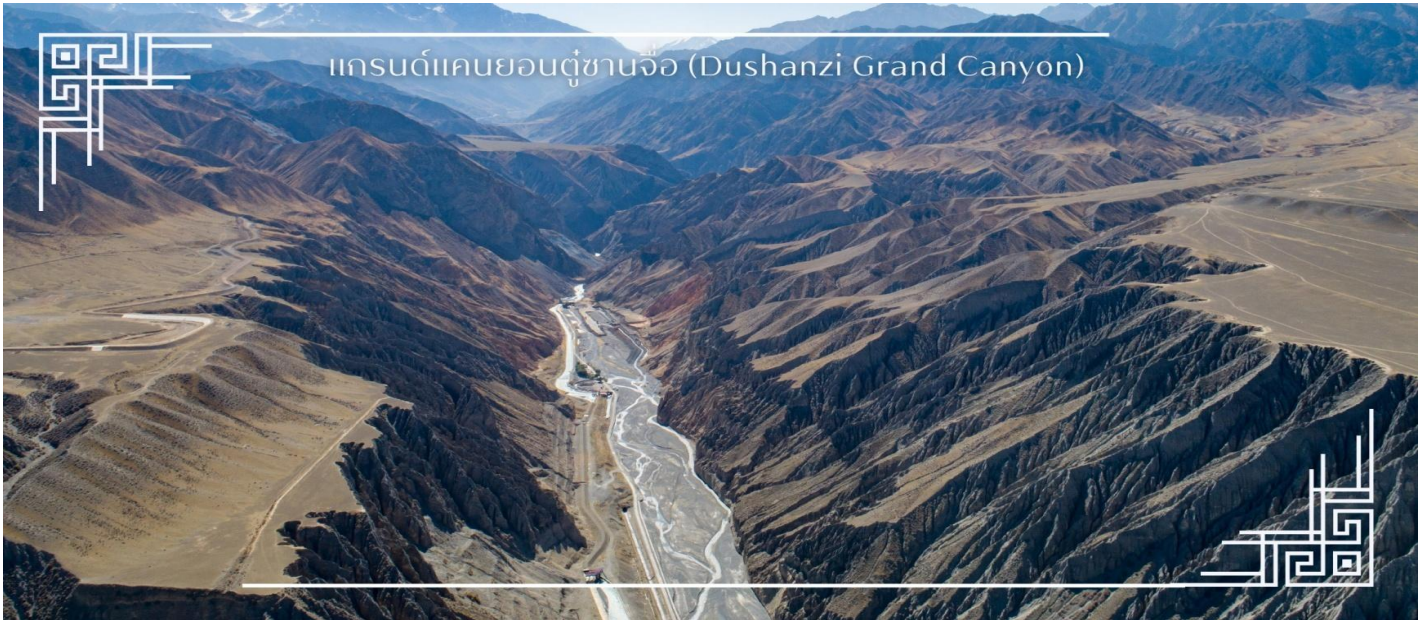
แกรนด์แคนยอนดูซานจือ (Dushanzi Grand Canyon)

เที่ยง บริการอาหารเที่ยง ณ ภัตตาคาร (มื้อที่2) นำท่านเดินทางสู่ เมืองโปล่เอ๋อ หรือ ป่อเอ๋อเล่อ(Bole) (ใช้เวลาเดินทางประมาณ 3.30 ชั่วโมง) ตั้งอยู่ทางตอนเหนือของ เขตปกครองตนเองซินเจียงอุยกูร์ เมืองศูนย์กลางของเขตปกครองตนเองมองโกลบอร์ตาลา โดดเด่นด้วยภูมิประเทศที่โอบ ล้อมด้วยทุ่งหญ้ากว้างใหญ่ ทะเลสาบใสสะอาด และแนวเทือกเขาสูงตระหง่าน