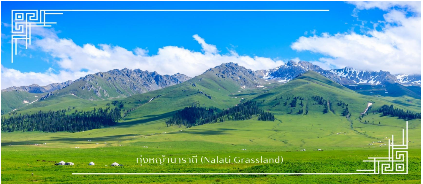
ทุ่งหญ้านาราตี (Nalati Grassland)

เที่ยง บริการอาหารเที่ยง ณ ภัตตาคาร (มื้อที่8) เมนูพิเศษ : สุกี้หม้อไฟ นำท่านเดินทางสู่ อีหนิง (ใช้เวลาเดินทางประมาณ 5ชั่วโมง) อิสระช้อปปิ้ง ถนนหลิวซิงเจียง (Liu Xing Jie) เมือง อีหนิง (Yining) ถนนคนเดินที่มีชีวิตชีวาและเต็มไปด้วยสินค้า หลากหลาย เหมาะสำหรับการเดินเล่น ช้อปปิ้ง และสัมผัสบรรยากาศท้องถิ่นอย่างใกล้ชิด สองข้างทางเรียงรายด้วย ร้านค้าของฝาก งานหัตถกรรมพื้นเมือง เสื้อผ้า เครื่องประดับ อาหารท้องถิ่น และร้านค้าแพรรยากาศอบอุ่น โดดเด่น ด้วยสถาปัตยกรรมสีสันสดใสที่ผสมผสานกลิ่นอายยุโรปและเอเชียกลางได้อย่างลงตัว