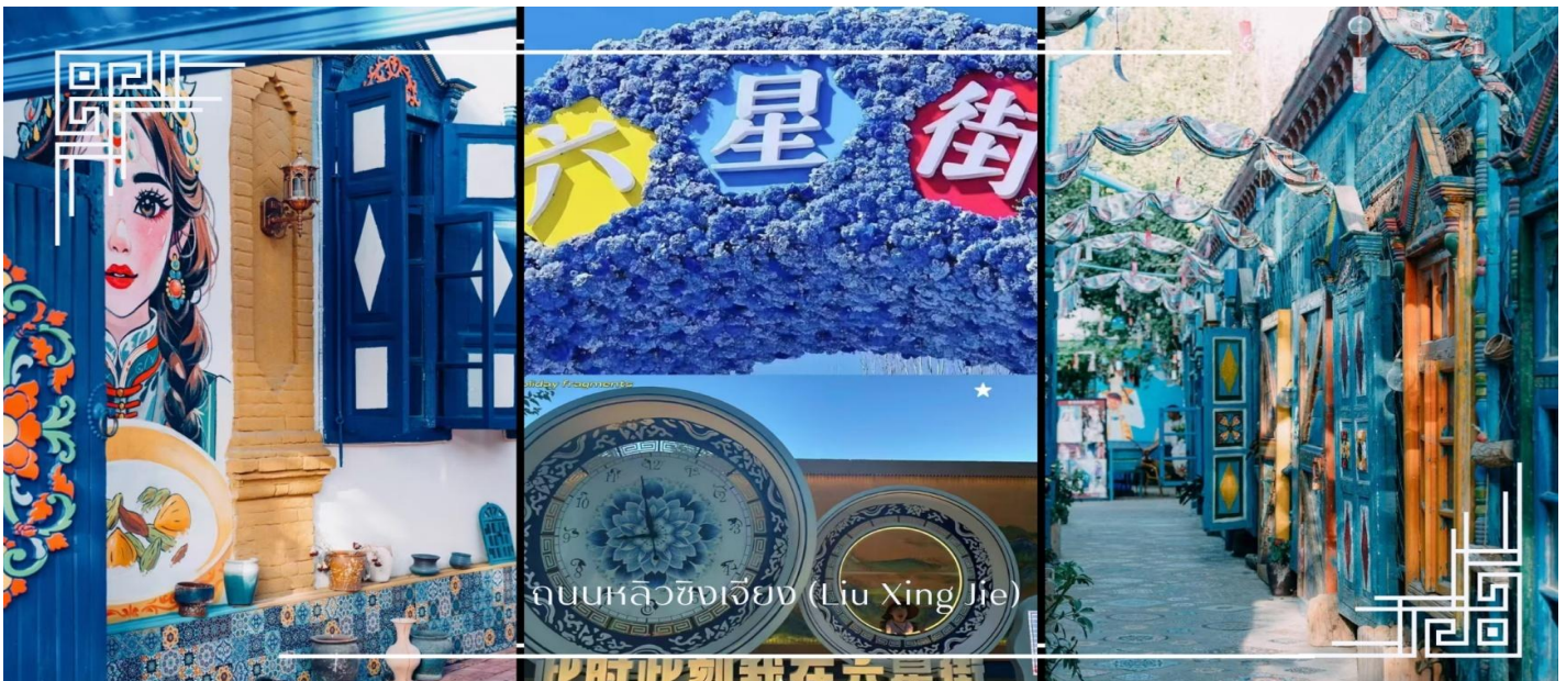
ถนนหลิวซิงเจียง (Liu Xing Jie)

เที่ยง บริการอาหารเที่ยง ณ ภัตตาคาร (มื้อที่8) เมนูพิเศษ : สุกี้หม้อไฟ นำท่านเดินทางสู่ อีหนิง (ใช้เวลาเดินทางประมาณ 5ชั่วโมง) อิสระช้อปปิ้ง ถนนหลิวซิงเจียง (Liu Xing Jie) เมือง อีหนิง (Yining) ถนนคนเดินที่มีชีวิตชีวาและเต็มไปด้วยสินค้า หลากหลาย เหมาะสำหรับการเดินเล่น ช้อปปิ้ง และสัมผัสบรรยากาศท้องถิ่นอย่างใกล้ชิด สองข้างทางเรียงรายด้วย ร้านค้าของฝาก งานหัตถกรรมพื้นเมือง เสื้อผ้า เครื่องประดับ อาหารท้องถิ่น และร้านค้าแพรรยากาศอบอุ่น โดดเด่น ด้วยสถาปัตยกรรมสีสันสดใสที่ผสมผสานกลิ่นอายยุโรปและเอเชียกลางได้อย่างลงตัว