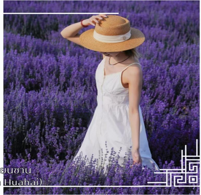
ทุ่งดอกไม้เทียนซาน (Yili Tianshan Huahai)

จากนั้นนำท่านสู่เมืองนาราตี (ใช้เวลาเดินทางประมาณ 3 ชั่วโมง)