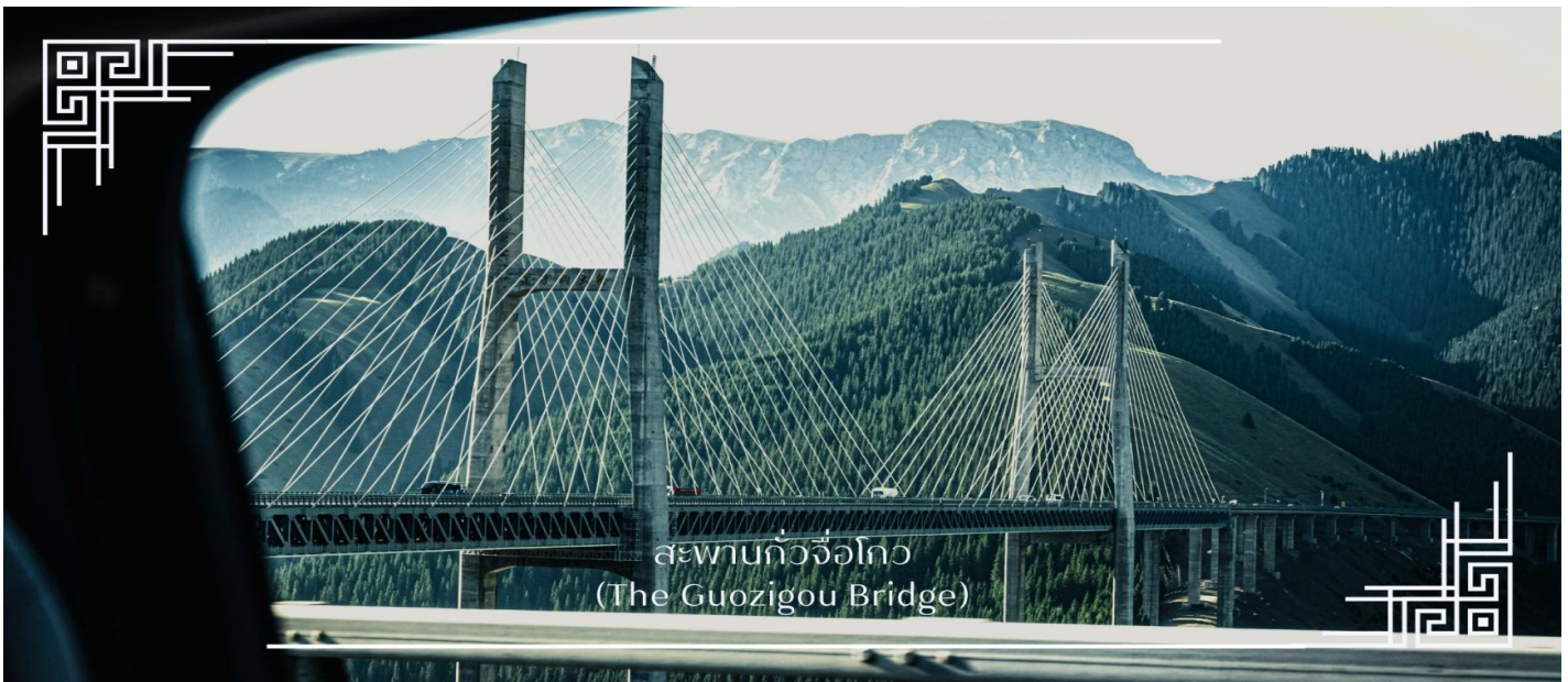
สะพานกัวจื่อโกว (The Guozigou Bridge)

จากนั้นนำท่านเดินทางสู่ ทุ่งดอกไม้เทียนซาน (ใช้เวลาเดินทางประมาณ 3 ชั่วโมง) โดยระหว่างทาง รถจะนำท่านผ่านชมความยิ่งใหญ่ของ สะพานกัวจื่อโกว(Guozigou Bridge) สะพานแขวนขนาดใหญ่ที่ทอดตัวข้ามหุบเขากัวจื่อโกวได้อย่างสง่างาม นับเป็นหนึ่งในผลงานวิศวกรรมที่โดดเด่นของจีนเจียง ด้วยโครงสร้างอันทันสมัยที่ผสมเข้ากับภูมิประเทศภูเขาสูง ทำให้ที่นี่เกิดเป็นภาพทิวทัศน์ที่น่าสนใจและสวยงามอย่างมาก