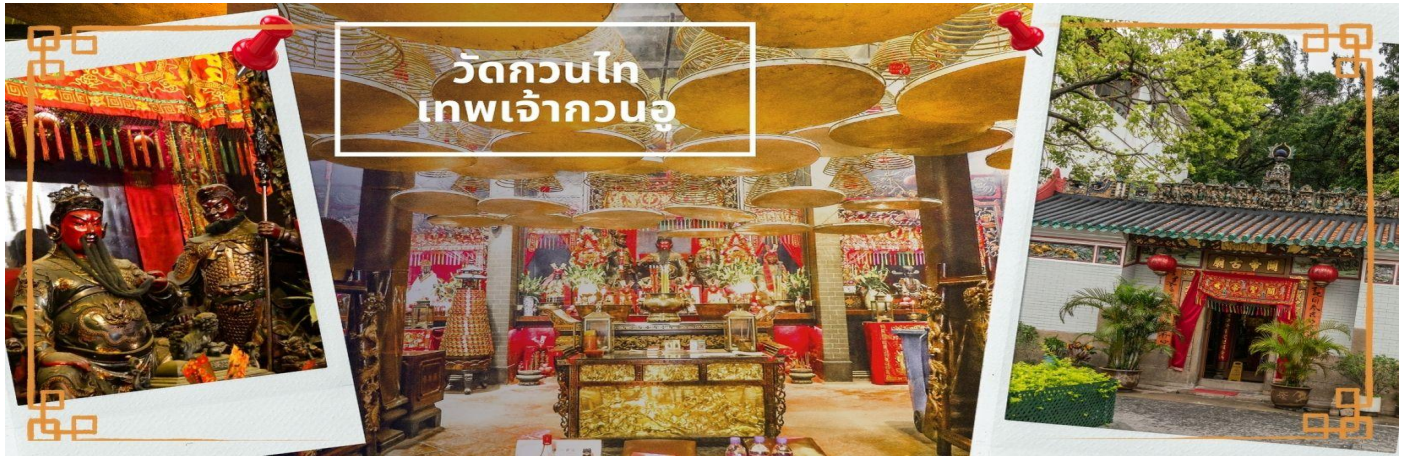
วัดกวนไท เทพเจ้ากวนอู

จากนั้นนำท่าน ไหว้ขอพรเรื่องเดินทาง การติดต่อ ค้าขาย วัดเจ้าแม่ทับทิมทินหัว (Tin Hau Temple) ที่ Yau Ma Tei เป็นวัดเก่าแก่ขนาดเล็ก อายุกว่า 150 ปี มีต้นกำเนิดมาจากวัดเล็กๆ ในพื้นที่ตลาด Kwun Chung เคยเป็นหมู่บ้านชาวประมงมาก่อน ตั้งแต่ปี 1864 เป็นวัดที่อุทิศให้กับทินหัว (หมาจิ้งจอก เทพเจ้าแห่งท้องทะเล) มีบรรยากาศที่สงบ ร่มรื่น ติดกับสวนสาธารณะเล็ก ๆ และนักท่องเที่ยวยังไม่พ่ลุกพ่ล่านมากจุดเด่นที่แนะนำคือ การปิดทองเรือมังกร เพื่อการทำงานการค้า ธุรกิจ ให้เจริญรุ่งเรือง