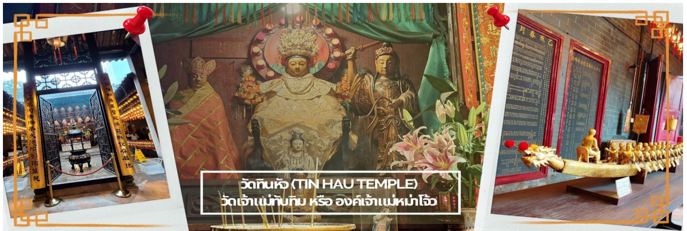
วัดทินหัว (TIN HAU TEMPLE) วัดเจ้าแม่ทับทิม หรือ องค์เจ้าแม่มาโจ้ว

จากนั้นนำท่าน ไหว้ขอพรเรื่องเดินทาง การติดต่อ ค้าขาย วัดเจ้าแม่ทับทิมทินหัว (Tin Hau Temple) ที่ Yau Ma Tei เป็นวัดเก่าแก่ขนาดเล็ก อายุกว่า 150 ปี มีต้นกำเนิดมาจากวัดเล็กๆ ในพื้นที่ตลาด Kwun Chung เคยเป็นหมู่บ้านชาวประมงมาก่อน ตั้งแต่ปี 1864 เป็นวัดที่อุทิศให้กับทินหัว (หมาจิ้งจอก เทพเจ้าแห่งท้องทะเล) มีบรรยากาศที่สงบ ร่มรื่น ติดกับสวนสาธารณะเล็ก ๆ และนักท่องเที่ยวยังไม่พ่ลุกพ่ล่านมากจุดเด่นที่แนะนำคือ การปิดทองเรือมังกร เพื่อการทำงานการค้า ธุรกิจ ให้เจริญรุ่งเรือง