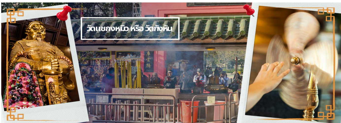
วัดแขกหมอ หรือ วัดกังหัน

เช้า ๑๐ | บริการอาหารเช้า ณ ภัตตาคาร **เมนูติ่มซำต้นตำหรับฮ่องกง** (3) นำท่านเดินทางสู่ วัดแขก ที่ชาถิ้น (CHE KUNG TEMPLE AT SHA TIN) วัดแขกสร้างขึ้นเพื่อเป็นอนุสรณ์เพื่อ ล่าลึกถึงตำนานแห่งนักรบราชวงศ์ซ่ง มีนามว่า “แซ กง” แม่ทัพปราบศึก ผู้คนทั่วทุกดินแดนต่างยำเกรงในกำลังพลอัน กล้าหาญแข็งแกร่งของแม่ทัพแขก ตั้งอยู่ในเขต SHATIN มีประวัติเล่าต่อกันมาว่า ขณะที่แม่ทัพปราบศึกอยู่ นั้น ทุกแคว้นเขตแดนแผ่นดินใหญ่ต่างก็ยำเกรงต่อกำลังพลที่กล้าหาญในกองทัพของท่าน ยามที่ออกรบเพื่อต้านข้าศึก ศัตรูทุกทิศทาง ทุก ๆ ครั้ง ท่านใช้สัญลักษณ์รูปกังหันนี้ 4 ใบพัดติดไว้ด้านหน้ารถศึกนำขบวนในกองทัพ เหล่าทหารกล้า มีความเชื่อว่าเมื่อพกพาสัญลักษณ์รูปกังหันนี้ไป ณ ที่ใด ๆ กังหันนี้จะช่วยเสริมสิริมงคล นำพาแต่ความโชคดี มี อำนาจเข้มแข็ง เสริมกำลังใจให้แก่กองทัพของท่าน ชื่อเสียงในการนำทัพสู้ศึกของท่านจึงเป็นตำนานมาจนทุกวันนี้ ปัจจุบันวัดแขก จึงเป็นสถานที่สักการะเคารพ ขอพร ท่านแขก โดยมีสัญลักษณ์เป็นกังหันนำโชคนั่นเอง 🌀 การหมุน กังหันนำโชคที่ตั้งอยู่ในวัด เพื่อจะได้หมุนเวียนชีวิตของเราและครอบครัวให้มีความเจริญก้าวหน้าด้านหน้าที่การงาน