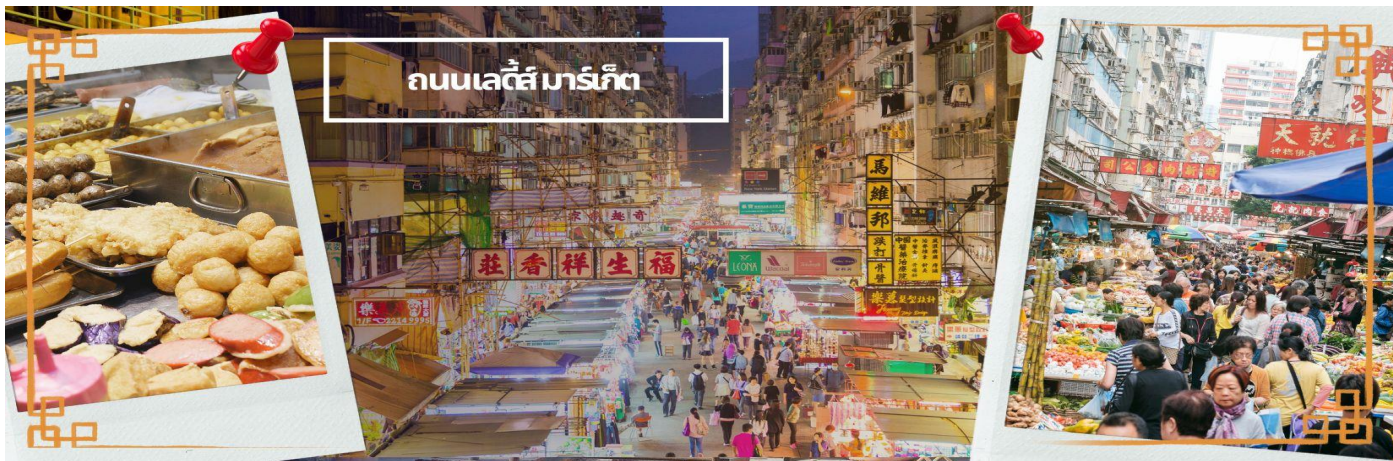
ถนนเลดี้ มาร์เก็ต

นำท่านเดินทางเข้าสู่ที่พัก RAMADA GRAND HOTEL/BEST WESTERN PLUS HOTEL ★★★★★ หรือเทียบเท่า ★★★★★ หรือเทียบเท่า