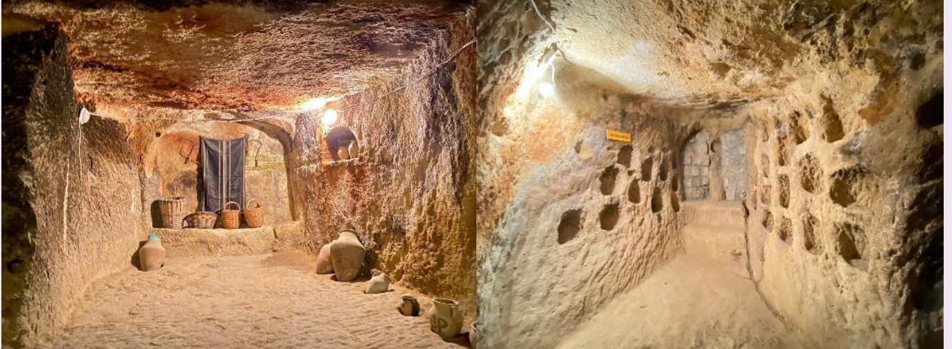
แนวถ่ายรูป หุบเขาอุชิซาร์ (UCHISAR VALLEY) หุบเขาคถ้ำจอมปลวกขนาดใหญ่ ใช้เป็นที่อยู่อาศัย ซึ่งหุบเขาดังกล่าวมีรูพรุน มีรอยเจาะ รอยขีด อันเกิดจากฝีมือมนุษย์ไปเกือบทั่วทั้งภูเขา เพื่อเอาไว้เป็นที่อยู่อาศัย