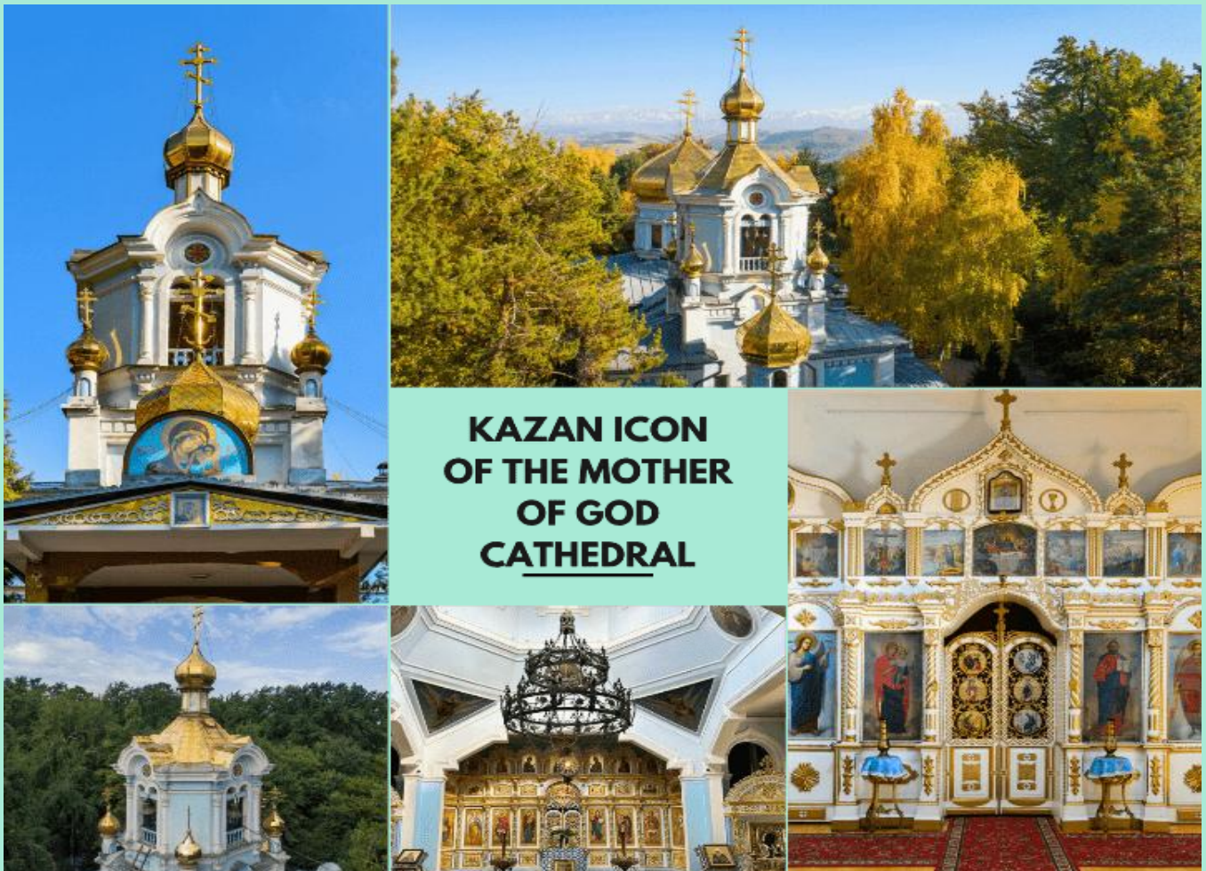
KAZAN ICON OF THE MOTHER OF GOD CATHEDRAL

นำท่านชม โบสถ์ใต้ดินคาซาน (Kazan Icon of the Mother of God Cathedral) สภาที่ศักดิ์สิทธิ์ลึกกลับใต้ดินแห่งเมืองอัลมาตีถูกซ่อนอยู่ในถ้ำใต้ดิน สร้างขึ้นโดยฝีมือช่างชาวรัสเซียในช่วงต้นศตวรรษที่ 20 เพื่อเป็นสถานที่ประกอบพิธีกรรมทางศาสนา ด้านโบสถ์ตกแต่งด้วยภาพจิตรกรรมของชาวคริสต์นิกายออร์ทอดอกซ์ บรรยากาศเย็นสงบ และเต็มไปด้วยยมนต์ขลัง (การเปลี่ยนสีของใบไม้ขึ้นอยู่กับสภาพอากาศ)