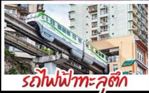
รถไฟฟ้ากะลุตัก