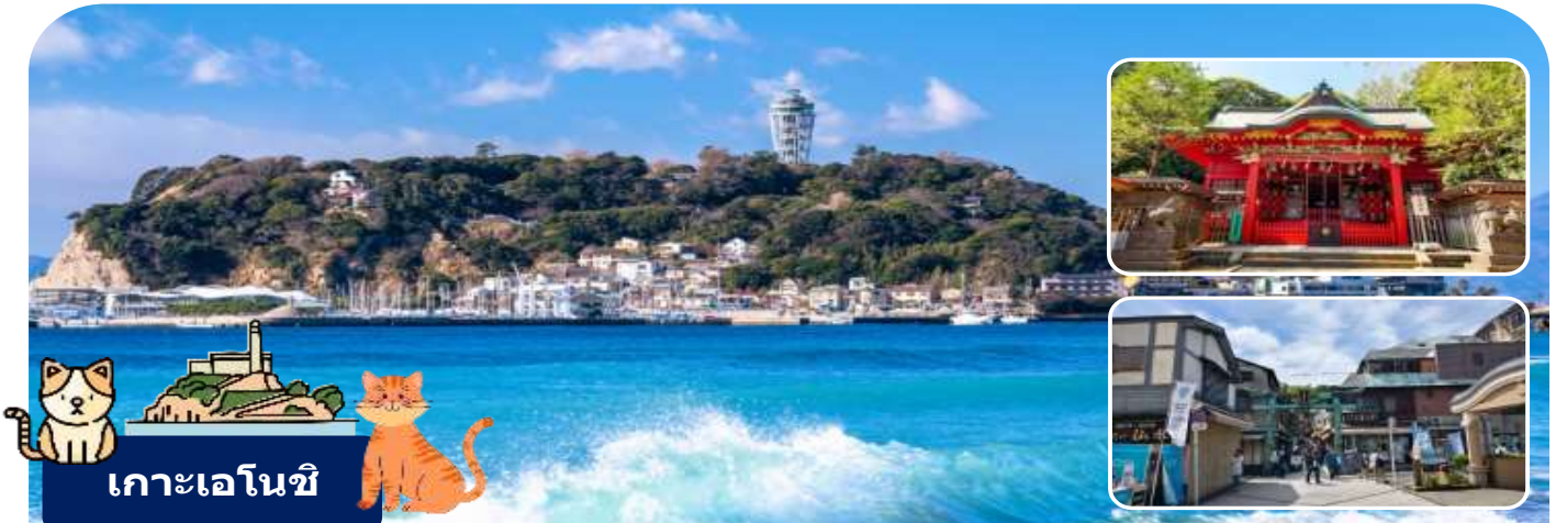
เกาะเอโนชิ

นำท่านเดินทางสู่เมืองคามาคุระ จังหวัดคางาวะ เมืองประวัติศาสตร์ที่ขึ้นชื่อเรื่องวัดวาอาราม และวิวทะเลสุดโรแมนติก ให้ท่านได้สัมผัสกลิ่นอายญี่ปุ่นแบบดั้งเดิมผสมผสานกับความสงบของธรรมชาติ