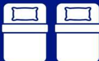
ห้องพักเตียงคู่ TWIN BED ROOM (TWN)

ห้องพักสำหรับ 1 ท่าน มีค่าใช้จ่ายเพิ่มจากค่าทัวร์