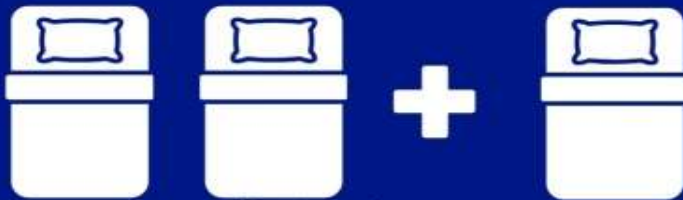
ห้องพักสำหรับสามท่าน (ที่นอนเสริม) TRIPLE BED ROOM (TRP)