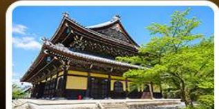
วัดนันเซ็นจิ