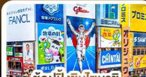
ช้อปปิ้งชินโซบาชิ และโดตงโบริ