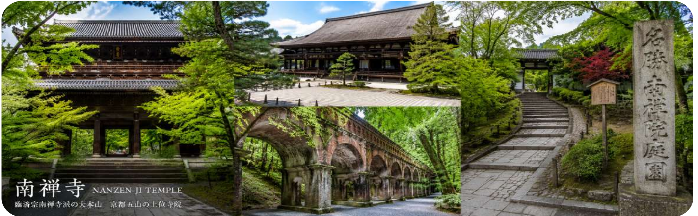
南禅寺 NANZEN-JI TEMPLE 臨濟宗南禅寺派の大本山 京都五山の土佐寺院

สมควรแก่เวลา นำคณะเดินทางสู่ วัดนันเซ็นจิ (Nanzen-ji) วัดเซนเก่าแก่และมีชื่อเสียงอันดับต้น ๆ ของเมืองเกียวโต สร้างขึ้นตั้งแต่สมัยศตวรรษที่ 13 โดดเด่นด้วย “ประตูซันมง” ขนาดใหญ่ซึ่งถือเป็นสัญลักษณ์สำคัญของวัด ท่ามกลางบรรยากาศเงียบสงบแบบญี่ปุ่นดั้งเดิม อีกหนึ่งไฮไลต์คือ “อุโมงค์ส่งน้ำโบราณ” สไตล์ตะวันตกที่ผสมผสานกับสถาปัตยกรรมญี่ปุ่นได้อย่างลงตัว กลายเป็นจุดถ่ายภาพยอดนิยมที่สวยงามในทุกฤดูกาล ให้ท่านได้สัมผัสเสน่ห์แห่งเกียวโตทั้งด้านประวัติศาสตร์ วัฒนธรรม และธรรมชาติในสถานที่เดียว