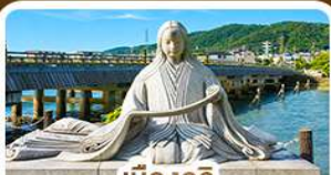
เมืองอุจิ สวรรค์คนรักชาเขียว