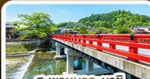
สะพานนากะบาชิ ทาคายาม่า