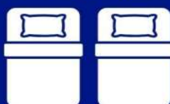
ห้องพักเตียงคู่ TWIN BED ROOM (TWN)

ห้องพักสำหรับ 1 ท่าน มีค่าใช้จ่ายเพิ่มจากค่าหัววีร์