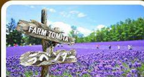
โกมิตะฟาร์ม