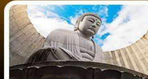
เป็นเจ้าแห่งพระพุทธรเจ้า