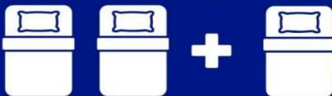
ห้องพักสำหรับสามท่าน (ที่นอนเสริม) TRIPLE BED ROOM (TRP)

ห้องพักสำหรับ 2 ท่าน • ห้องพักมีจำนวนน้อยและ อาจมีขนาดห้องเล็กกว่าห้อง TWN • กรณีไม่มีห้องพักประเภทนี้ จะเปลี่ยนเป็นห้อง TWN แทน