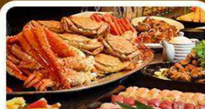
บุฟเฟต์ชาบู+ชาบู 3 ชนิด