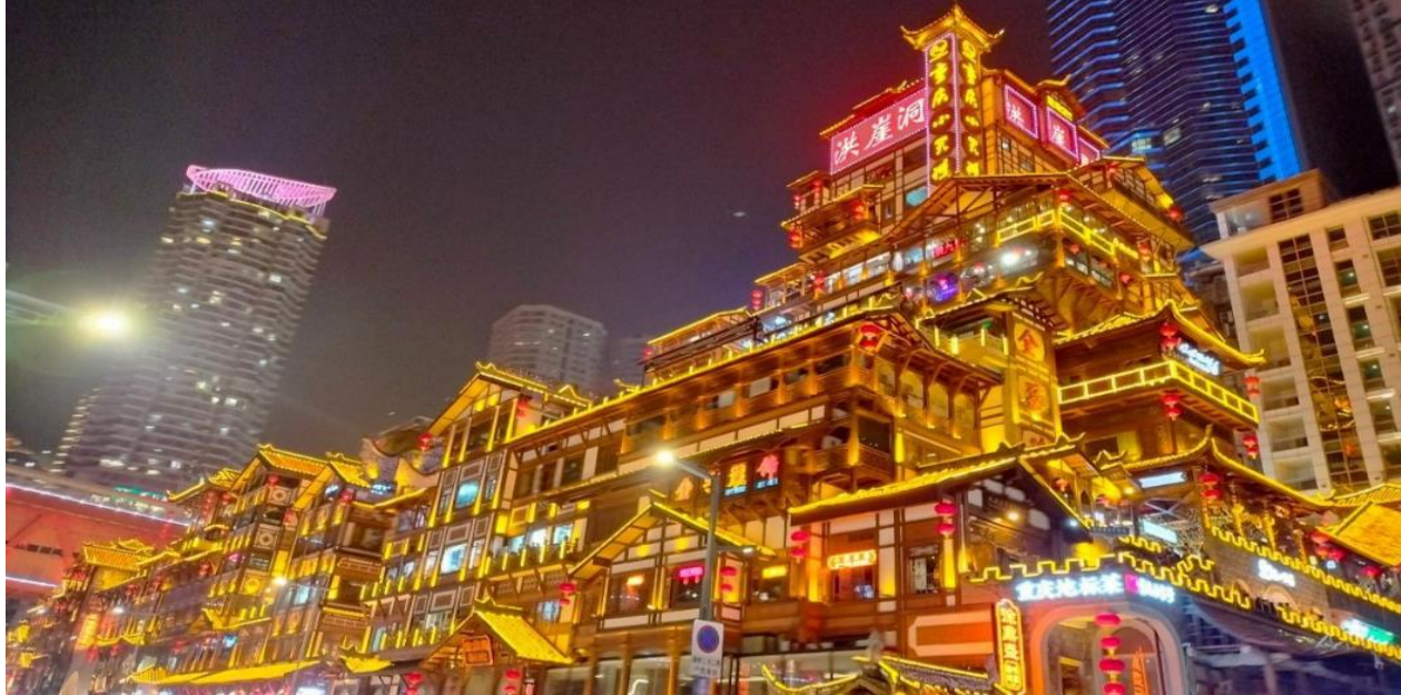
ที่พัก HOLIDAY INN SUITES CHONGQING JINHUI หรือระดับเทียบเท่า 4 ดาว

นำท่านชมความงดงามยามค่ำคืน หงหยาดัง คอมเพล็กซ์ในรูปแบบทรงแกรนด์โบราณขนาดใหญ่ ภายในมีร้านค้า ร้านอาหาร ร้านขายสินค้าที่ระลึก ฯลฯ ที่นี่ถือเป็นจุดนัดพบพักผ่อนของชาวเมือง และจุดชมวิวชั้นดี อีกทั้งยังเป็นจุดถ่ายรูปที่สำคัญของนักท่องเที่ยวอีกด้วย