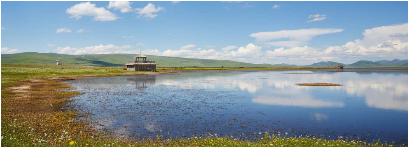
กลางวัน รับประทานอาหารกลางวัน ณ ภัตตาคาร (เมื่อที่ 17)

ขจี อากาศที่บริสุทธิ์และบางเบา มีเพียงเสียงลมที่พัดผ่านยอดหญ้าและเสียงนกน้ำที่ขับขานเป็นท่วงทำนองแห่งธรรมชาติ บรรยากาศอันเจียบสงบจะชะล้างความเหนื่อยล้าให้หมดสิ้นไปในทันที ทะเลสาบแห่งนี้ไม่ได้เป็นเพียงความงดงามทางสายตา แต่ยังเป็นพื้นที่ชุ่มน้ำอันอุดมสมบูรณ์และมีความสำคัญยิ่งต่อระบบนิเวศบนที่ราบสูงทิเบต ถือเป็นแหล่งพักพิงและสวรรค์ของเหล่ากอพยพนานาชนิด โดยเฉพาะอย่างยิ่ง "นกกระเรียนคอดำ" สัตว์ปีกสง่างามอันเป็นสัญลักษณ์แห่งความสุขและอายุยืนยาวในวัฒนธรรมทิเบต ในช่วงฤดูร้อนทุ่งหญ้ารอบทะเลสาบจะผลิดอกไม้ป่านานาพรรณ กลายเป็นภาพวาดสีสดใสที่ธรรมชาติรังสรรค์ขึ้น เชิญท่านทอดน่องไปตามสะพานไม้ที่ทอดยาวเหนือผืนน้ำ สูดอากาศอันแสนสดชื่นให้เต็มปอด พร้อมเก็บภาพความประทับใจของผืนน้ำจืดขอบฟ้า ที่ซึ่งฝูงปศุสัตว์ของชาวทิเบตพื้นเมืองกำลังเล็มหญ้าอย่างอิสระอยู่ไกลๆ