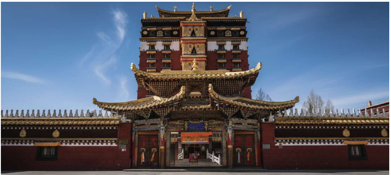
บ่าย นำท่านเดินทางสู่ หอฟพระมิลารปะ (ระยะทาง 134 ก.ม. ใช้เวลาเดินทางประมาณ 2 ชั่วโมง) สู่ใจกลางศรัทธา หอพระ 9 ชั้น มิลารปะ สถาปัตยกรรมทางพุทธศาสนาที่น่าอัศจรรย์ใจและเป็นหนึ่งเดียวใน