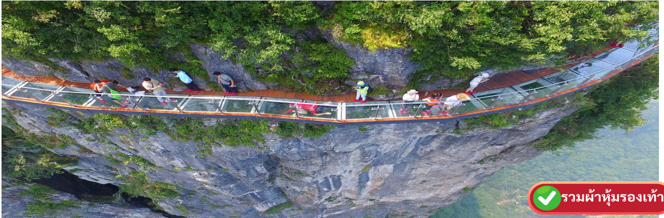
รวมผ้าห่มรองเท้า