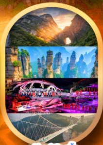
ฟรีเดย์เลือกซื้อ Option เสริม