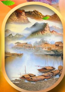
พิพิธภัณฑสถานภาพหินทราย