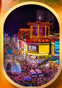
ถนนคนเดินชิงลู่