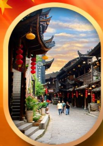
เมืองโบราณฟูหลงเจิน