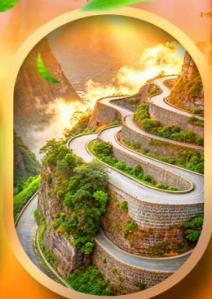
หุบเขาปายจาง