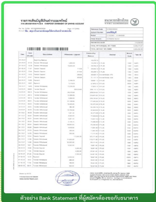
ตัวอย่าง Bank Statement ที่ผู้สมัครต้องขอกับธนาคาร