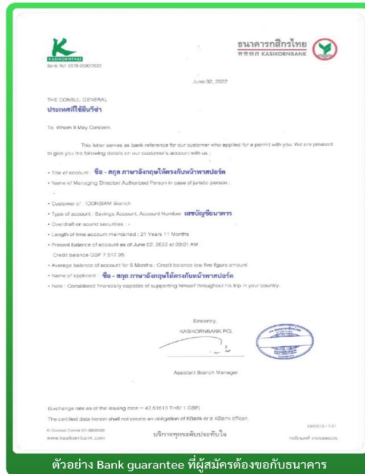
ตัวอย่าง Bank guarantee ที่ผู้สมัครต้องขอกับธนาคาร