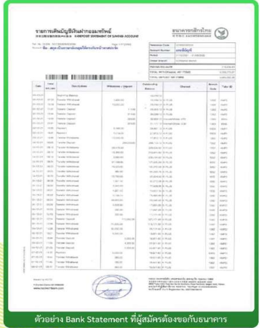
ตัวอย่าง Bank Statement ที่ผู้สมัครต้องขอกับธนาคาร