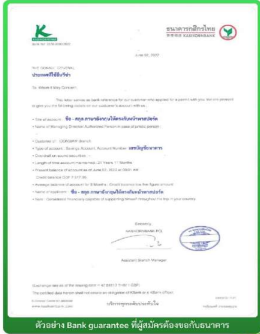
ตัวอย่าง Bank guarantee ที่ผู้สมัครต้องขอกับธนาคาร