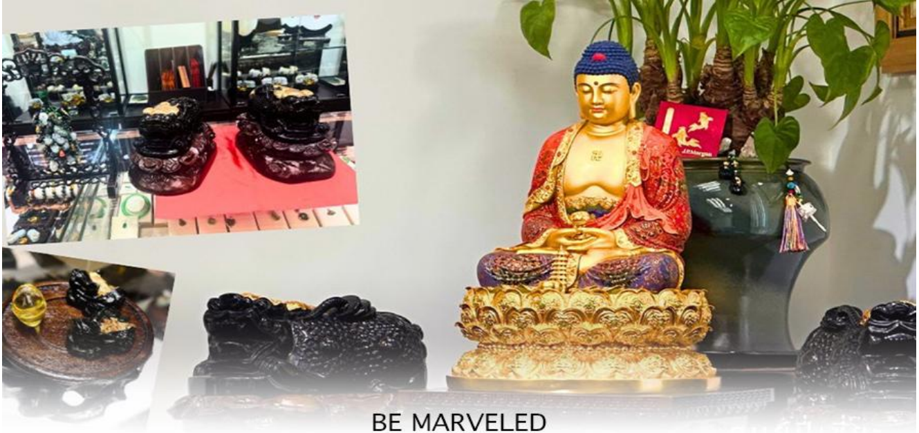
BE MARVELED ศูนยี่ปีเซี่ยะ

และนำท่านชม ศูนยี่ปีเซี่ยะ ซึ่งคนจีนนั้นนั้น ถือว่าหยกเป็นหิน ที่เป็นตัวแทนของความสวยงามและความบริสุทธิ์ที่มีความเชื่อว่า หยก มงคล ถ้าพกติดตัวไว้จะอายุยืนและสุขภาพดีมีสินค้ามากมายเกี่ยวกับหยก อาทิ กำไลหยก หรือสัตว์นำโชคอย่างปีเซี่ยะ ให้ท่านได้เลือกซื้อเป็นของฝาก, ของที่ระลึก หรือของนำโชคแต่ตัวท่านเอง