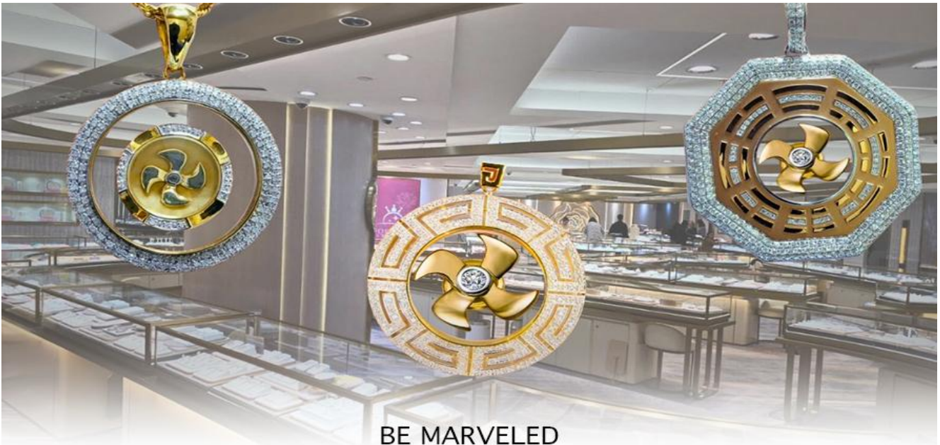
BE MARVELED ศูนย์ฮวงจุ้ย กังหันเสริมสิริ

นำท่านชม ศูนย์ฮวงจุ้ย กังหันเสริมสิริ ที่ขึ้นชื่อของฮ่องกง ท่านจะได้พบกับงานดีไซน์ที่ได้รับรางวัลยอดเยี่ยม และใช้ในการเสริมดวงเรื่องฮวงจุ้ย ศูนย์ฮวงจุ้ยกังหันเสริมสิริ วัดแซกง" ไม่ใช่ชื่อวัดโดยตรง แต่เป็นชื่อที่เกี่ยวข้องกับ วัดแซกงหมิว (Che Kung Temple) ในฮ่องกง ซึ่งเป็นที่รู้จักกันดีในเรื่อง กังหันนำโชค ที่เชื่อว่าสามารถหมุนปัดเป่าสิ่งชั่วร้ายและนำโชคลากเข้ามาในชีวิต