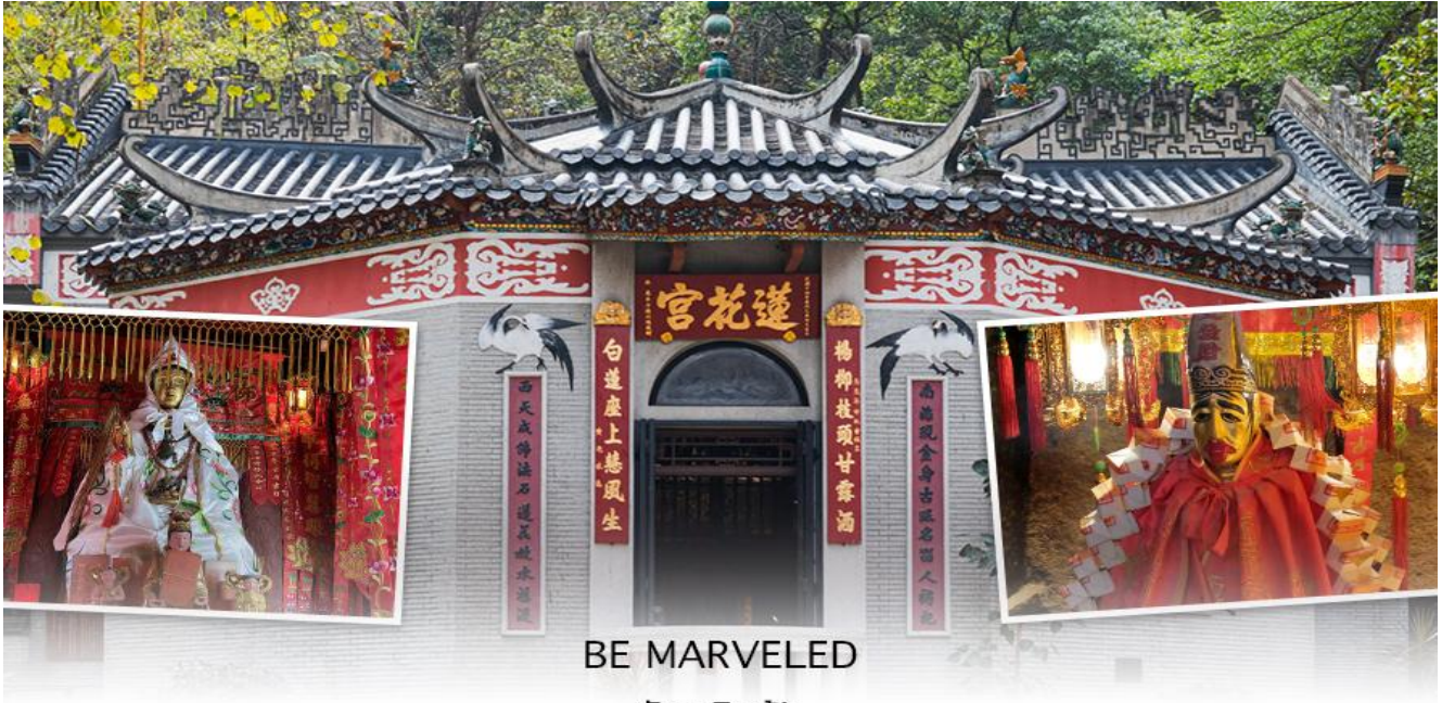
BE MARVELED วัดหันฟ้า

จากนั้นนำท่านเดินทางสู่ วัดปักไต่ หรือ วัดยุคสุข เป็นวัดที่มีประวัติมายาวนาน 160 ปีตั้งอยู่ในเขต WAN CHAI มีเทพปักไต่ เป็นเทพเจ้าหลักของวัด และยังเป็นเทพจักรพรรดิเหนือ หรือ เทพแห่งท้องทะเลเชื่อกันว่าท่านมีอำนาจ ปกป้องผู้คนจากภัยพิบัติ ขับไล่วิญญาณชั่วร้าย และให้ความคุ้มครองแก่ลูกหลานเป็นวัดที่บูชาเทพเจ้าแห่งท้องทะเล ในลัทธิเต๋า และชาวฮ่องกงเชื่อกันว่าผู้ใดที่เกิดปีชง หากมาทำการแก้ดวงชะตาแก้ชงประจำปีที่นี่ จะทำให้ร้าย กลายเป็นดีได้ และที่วัดยังมี “เทพเจ้าเป่ลี่ยนใจ” ที่นิยมมาขอพรให้เรื่องที่ไม่ดี กลายเป็นเรื่องดีหรือคนที่เป่ลี่ยนใจมาเป็นมิตร เป็นที่นิยมอย่างมากของชาวฮ่องกงมาราบไหว้ขอพรกันที่วัดนี้