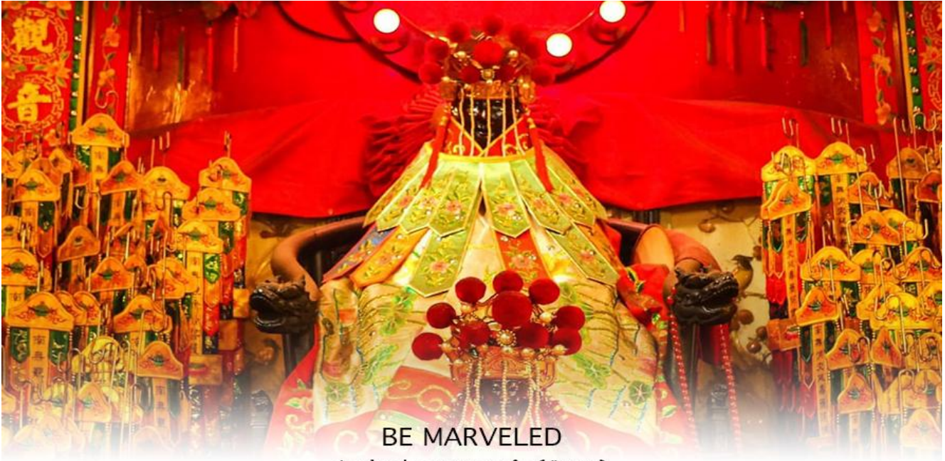
BE MARVELED วัดเจ้าแม่กวนอิมฮวงอ่า (ยิมเิน)

นำท่านชม ศูนย์ฮวงจุ้ย กังหันเสริมสิริ ที่ขึ้นชื่อของฮ่องกง ท่านจะได้พบกับงานดีไซน์ที่ได้รับรางวัลยอดเยี่ยม และใช้ในการเสริมดวงเรื่องฮวงจุ้ย ศูนย์ฮวงจุ้ยกังหันเสริมสิริ วัดแซกง" ไม่ใช่ชื่อวัดโดยตรง แต่เป็นชื่อที่เกี่ยวข้องกับ วัดแซกงหมิว (Che Kung Temple) ในฮ่องกง ซึ่งเป็นที่รู้จักกันดีในเรื่อง กังหันนำโชค ที่เชื่อว่าสามารถหมุนปัดเป่าสิ่งชั่วร้ายและนำโชคลากเข้ามาในชีวิต