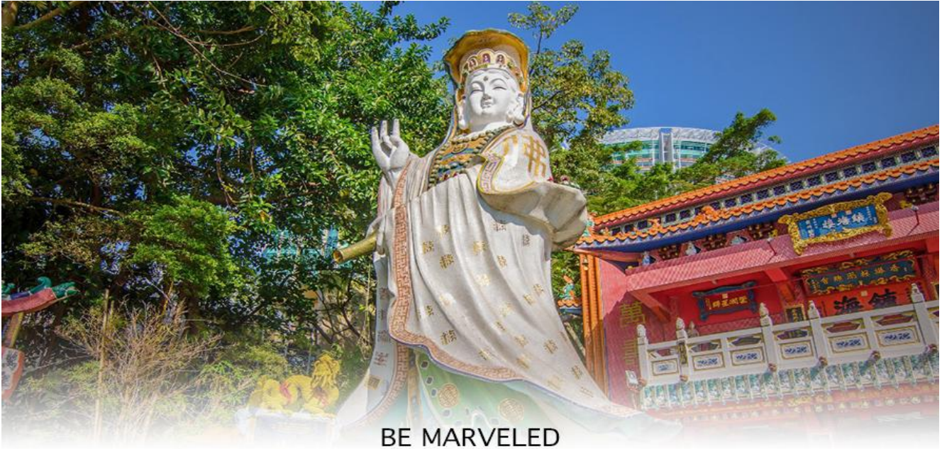
BE MARVELED วัดเจ้าแม่กวนอิมริพลัสเบีย