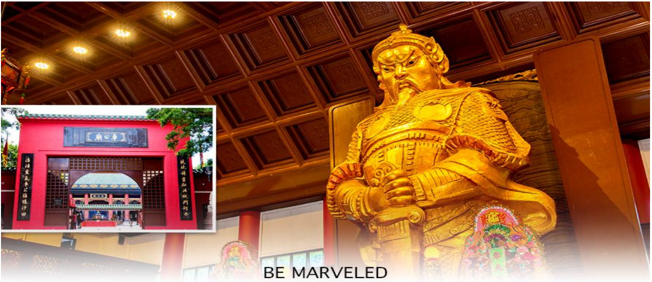
BE MARVELED วัดแขก

จากนั้นนำท่าน ช้อปปิ้ง ย่านจิมซาจอย เป็นแหล่งช้อปปิ้งชื่อดัง มีร้านขายของทั้งเครื่องหนัง, เครื่องกีฬา, เครื่องใช้ไฟฟ้า, กล้องถ่ายรูป, อุปกรณ์อิเล็กทรอนิกส์และสินค้าแบบที่เป็นของพื้นเมืองฮ่องกงอยู่ด้วย อีกทั้งสินค้าแบรนด์เนม รวมถึงร้านอาหาร ตั้งอยู่บนถนนนาธาน ถนนทอดยาวตั้งแต่จิมซาจอย จนถึงย่านปรีนซ์เฮ็ดเวิร์ด เต็มไปด้วยร้านค้าต่าง ๆ มากมาย ทั้งเสื้อผ้าแบรนด์เนมระดับ HI-END ชื่อดังทั่วโลก ห้างสรรพสินค้าที่ทันสมัย จากถนน นาธานไปที่ถนนแคนตัน ท่านจะตื่นตาตื่นใจไปกับเอาต์เล็ตแบรนด์ที่เรียงติดกันเป็นแถบ นอกจากนี้ยังมี HARBOUR CITY ศูนย์การค้ายักษ์ใหญ่ของฮ่องกง ซึ่งมีร้านค้ากว่า 450 ร้านรวมอยู่ที่นี่ และมี SHOPPING COMPLEX ขนาดใหญ่ชื่อ OCEAN TERMINAL ซึ่งประกอบไปด้วยห้างสรรพสินค้า