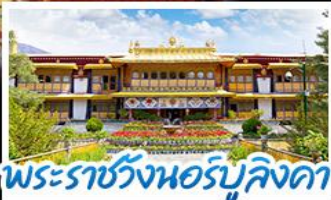
พระราชวังนอร์บูลิงคา