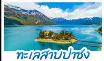
ทะเลสาบปาซง

รถไฟสายหลังคาโลก พระราชวังโปตาลา วัดโจคัง - ทะเลสาบปาซง พระราชวังฤดูร้อนนอร์บูลิงคา