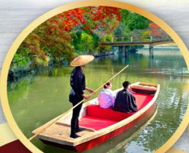
กิจกรรมล่องเรือยานากาวะ