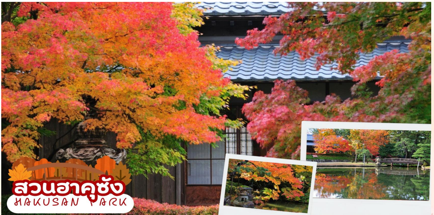
สวนฮาคูซัง HAKUSAN PARK

สวนฮาคูซัง (Hakusan Park) เป็นสวนสาธารณะประจำเมืองนิงะตะ ที่ออกแบบโดยได้รับแรงบันดาลใจจากชาวตะวันตก ตั้งอยู่ติดกับ ศาลเจ้าฮาคูซัง (Hakusan Shrine) และได้รับการยอมรับว่าเป็นหนึ่งในสวนสาธารณะในเมือง 100 อันดับแรกของญี่ปุ่น สวนมีความงามตามฤดูกาลที่หลากหลาย เช่น ดอกซากุระในฤดูใบไม้ผลิ ดอกบัวในฤดูร้อน ใบไม้เปลี่ยนสีในฤดูใบไม้ร่วง และหิมะในฤดูหนาว (ใบไม้เปลี่ยนสีขึ้นอยู่กับสภาพอากาศ)