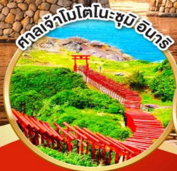
ศาลเจ้าโมโตโนะซุมิ อิบาริ