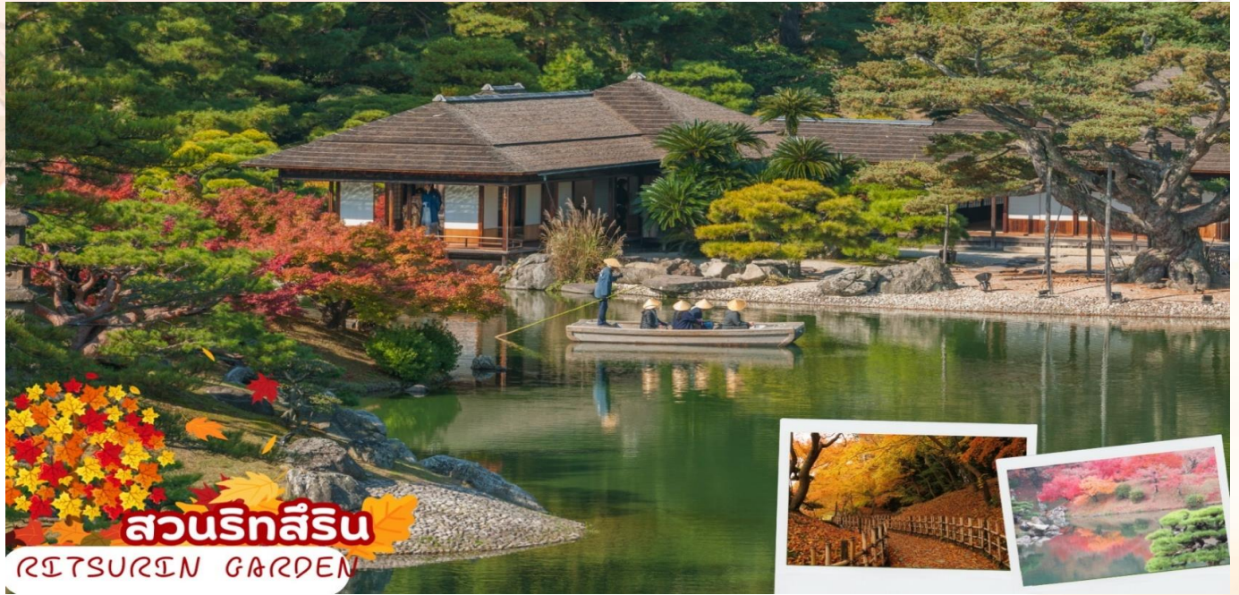
สวนริทสุริน

ต้นสน สะพาน และการจัดวางหินต่าง ๆ งดงามลงตัว เหมาะจะถ่ายรูปทิวทัศน์สวย ๆ เก็บไว้เป็นที่ระลึก ภายในสวนมีต้นไม้ ดอกไม้หลายสายพันธุ์ปลูกไว้ทั่วบริเวณเช่น ต้นซากุระ ต้นบ๊วย ต้นเมเปิ้ล สวนดอกไอริส เป็นต้น โดยเฉพาะต้นสนเก่าแก่ที่มีจำนวนมากกว่า 1,000 ต้น