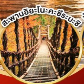
สะพานอียะโนะคะชิระบะชิ