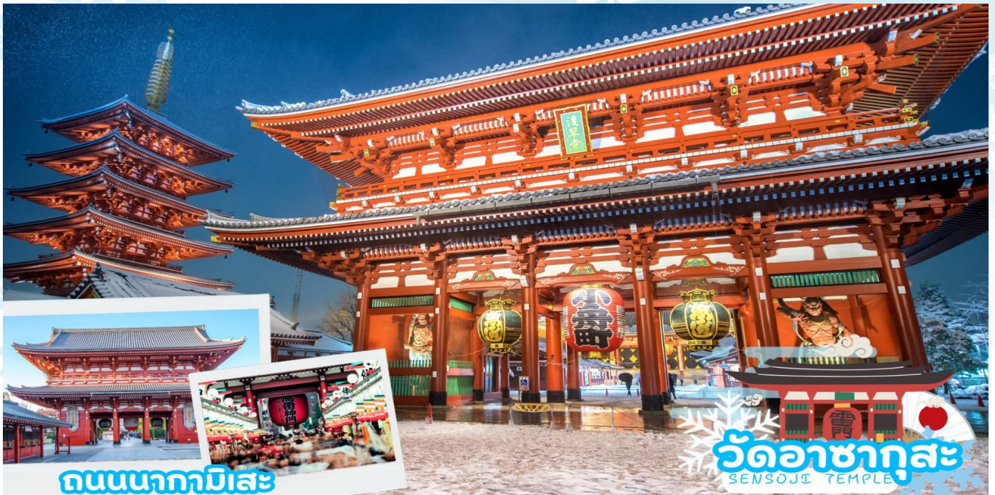
ถนนนากามิसे