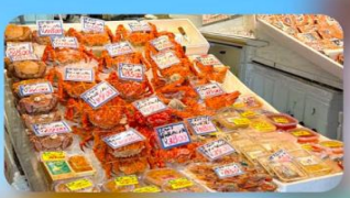
ตลาดปลาโจโก