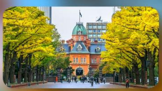
อัสสะตามอัสสะคัย 1 วัน