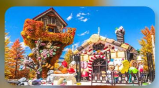
โรงงานช็อกโกแลต ชิโรอิ โคอิบิโตะ