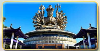
วัดกวนอิมหยวนเต้า