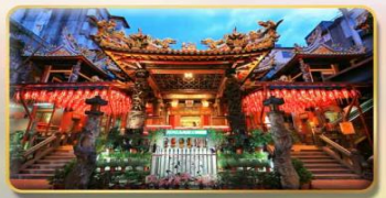
วัดเทียนฮั่ว เจ้าวรเจ้าแม่หม่าจู้