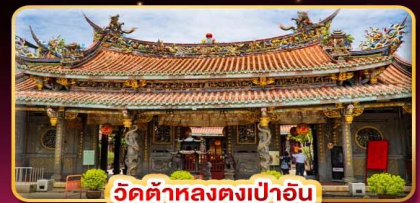
วัดต้าหลงตงเป่าอัน