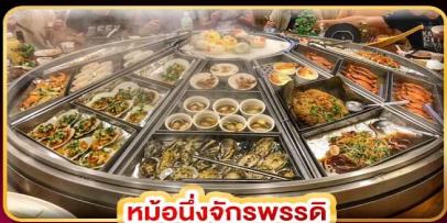
หม้อหนึ่งจักรพรรดิ

ปล่องโดมลอยฟ้าทางรถไฟผิงซี บินคุ้ม เที่ยวครบ เช็กอินจุดไฮไลท์