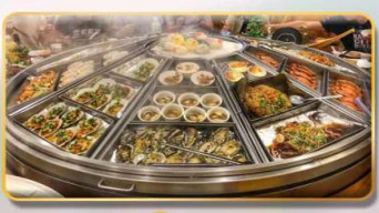
หม้อนึ่งจักรพรรดิ