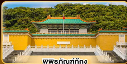
พิพิธภัณฑท์กุง