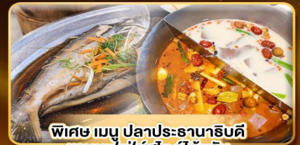
พิเศษ เมนู ปลาประ-ธานาริบดี ซาบูนุฟิเพ็ดสโตลส์ไต้หวัน