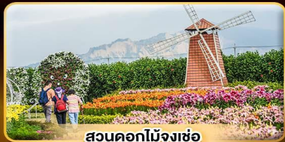
สวนดอกไม้จงซ้อ

เด้าท์ดาวน้ำตึกไทเป 101 ชมพิพิธภัณฑท์กุง น้ำพุร้อนเปียวโตว