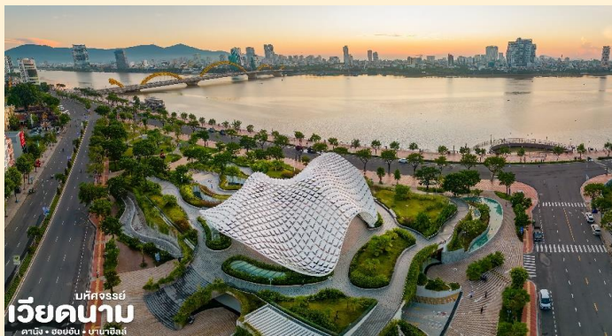
เวียดนาม บั๊กซง ดานัง • ฮอยอัน • บานาฮิลล์

นำท่าน แวะถ่ายรูปที่ Apec Park เป็นสวนสาธารณะ ริมแม่น้ำฮัน สวนเอเปค สถานที่ท่องเที่ยวแห่งใหม่ แห่ง เมืองดานัง บริเวณสวนมีสนามหญ้าขนาดใหญ่ ทางเดินปูด้วยหิน สวนหย่อมและยังสามารถมองเห็น แม่น้ำฮัน มีพื้นที่พักผ่อนมากมาย ร้านขายของที่ ระลึก ร้านอาหาร ร้านกาแฟ ไฮไลท์ของสวน APEC แห่งนี้คือ โดมขนาดยักษ์ที่สร้างจากเหล็ก 200 ตัน มี