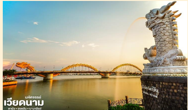
เวียดนาม บั๊กซง ดานัง • ฮอยอัน • บานาฮิลล์

จากนั้น นำท่านชม สะพานมังกร Dragon Bridge อีก หนึ่งที่เที่ยวดานังแห่งใหม่ สะพานมังกรไฟ สัญลักษณ์ความสำเร็จแห่งใหม่ของเวียดนาม ที่มีความยาว 666 เมตร ความกว้างเท่าถนน 6 เลนส์ เชื่อมต่อสองฟากฝั่งของแม่น้ำฮัน ประเทศเวียดนาม สะพานมังกรถูกสร้างขึ้น เพื่อเป็นแหล่งท่องเที่ยวดานัง เป็นสัญลักษณ์ ของการฟื้นคืนประเทศ และเป็นการฟื้นฟูเศรษฐกิจของประเทศ โดยได้เปิดใช้งานตั้งแต่ปี 2013 ด้วยสถาปัตยกรรมที่บวกกับเทคโนโลยีสมัยใหม่ที่ได้รับแรงบันดาลใจจากตำนานของเวียดนามเมื่อ กว่าหนึ่งพันปีมาแล้ว