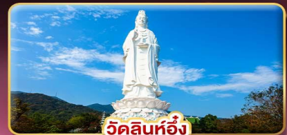
วัดลินท๋อง