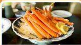
พิเศษ! ขาปู