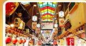
ตลาดปลาฮิชิ