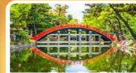
ศาลเจ้าสุมิโยชิ โทคะ