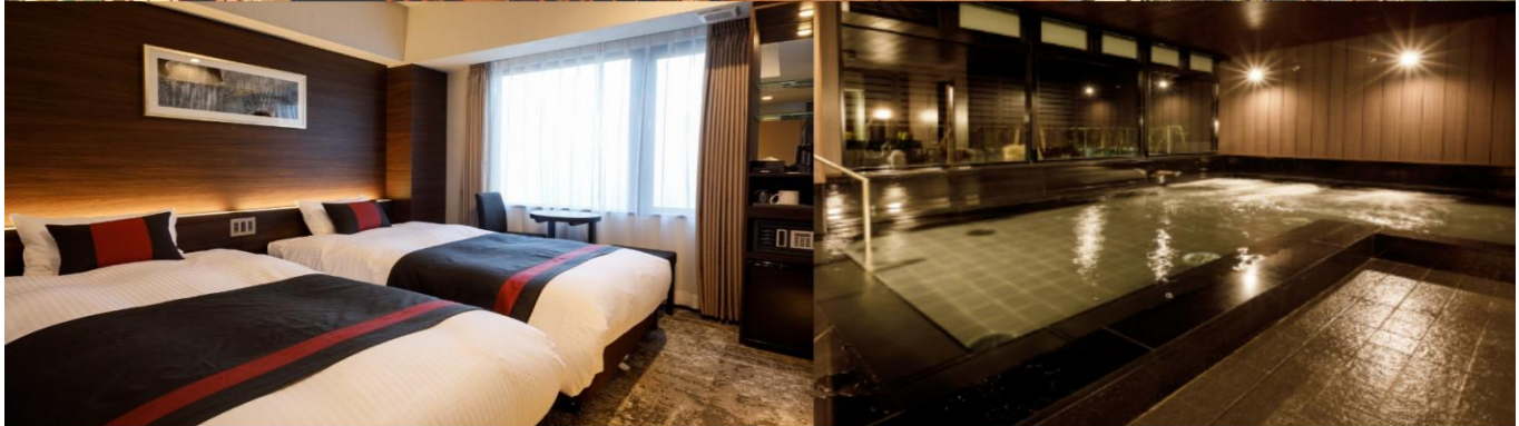
Standard Twin Room 16-17 sqm