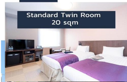
Standard Twin Room 20 sqm

โรงแรมที่ระบุในโปรแกรมเป็นโรงแรมที่น่าเสนอเบื้องต้นเท่านั้น อาจจะมีการเปลี่ยนแปลงได้ ทางบริษัทขอสงวนสิทธิ์ในการปรับเปลี่ยนที่พักไปเมืองใกล้เคียงในกรณีที่ในช่วงงานแพร่หรือเทศกาล