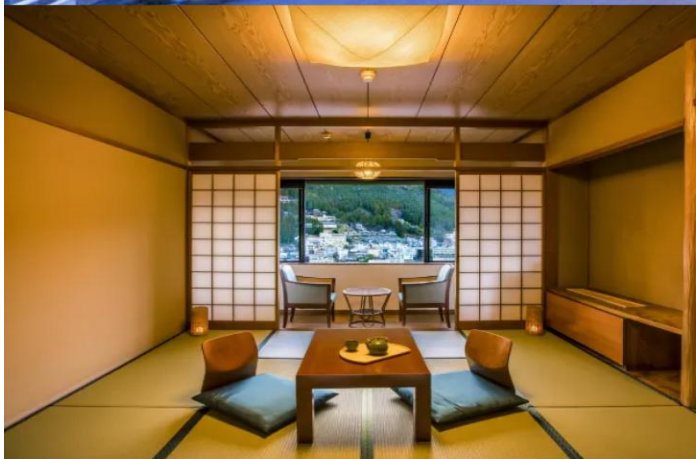
Standard Japanese-style Room 49.5m