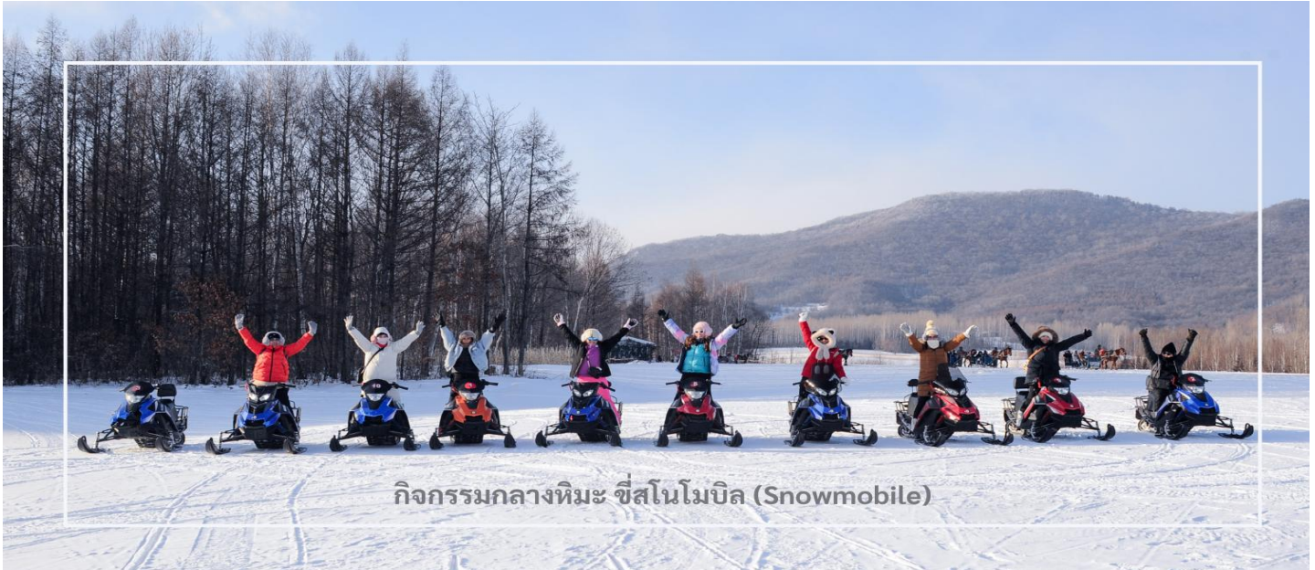
กิจกรรมกลางหิมะ ขี่สโนว์โมบิล (Snowmobile)

สนุกสนานกับอีกหนึ่งกิจกรรมยอดนิยมของฤดูหนาว นั่นคือ การขับสโนว์โมบิล (Snowmobile ) สัมผัสความตื่นเต้นเร้าใจ กับการขับเคลื่อนฝ่าสนามหิมะอันกว้างใหญ่ ท่ามกลางบรรยากาศของภูเขาและป่าสนที่ปกคลุมด้วยหิมะขาวราวกับเทพนิยาย อีกหนึ่งกิจกรรมสุดมันส์ที่ไม่ควรพลาดในการผจญภัยท่ามกลางฤดูหนาวของเมืองหนาวสุดขีด (รวมค่ากิจกรรม ใช้เวลาประมาณ 20-30 นาที)