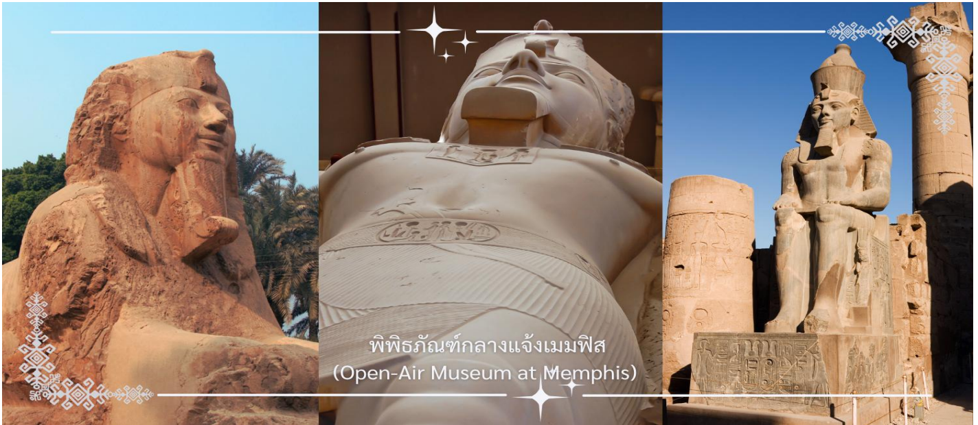
พิพิธภัณฑสถานกลางแจ้งแห่งเมมฟิส (Open-Air Museum at Memphis)

นำท่านเดินทางสู่ ซัคคารา (Saqqara) หนึ่งในสุสานหลวงที่สำคัญที่สุดของอียิปต์โบราณ ตั้งอยู่ทางใต้ของกรุงไคโร เป็นส่วนหนึ่งของเนโครโพลิสแห่งเมมฟิส ที่นี่ถือเป็นต้นแบบของการสร้างพีระมิดในยุคแรกเริ่ม และยังเป็นที่ตั้งของ พีระมิดขั้นบันได (Step Pyramid) อันเลื่องชื่อของฟาโรห์โจเซอร์ (Djoser)