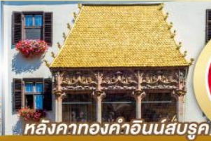
หลังคาทองคำอินน์ส์บรุค