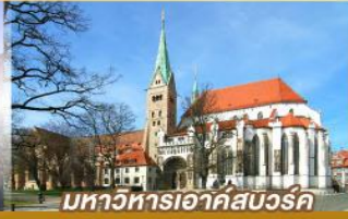
มหาวิหารเอาคัสบวร์ค