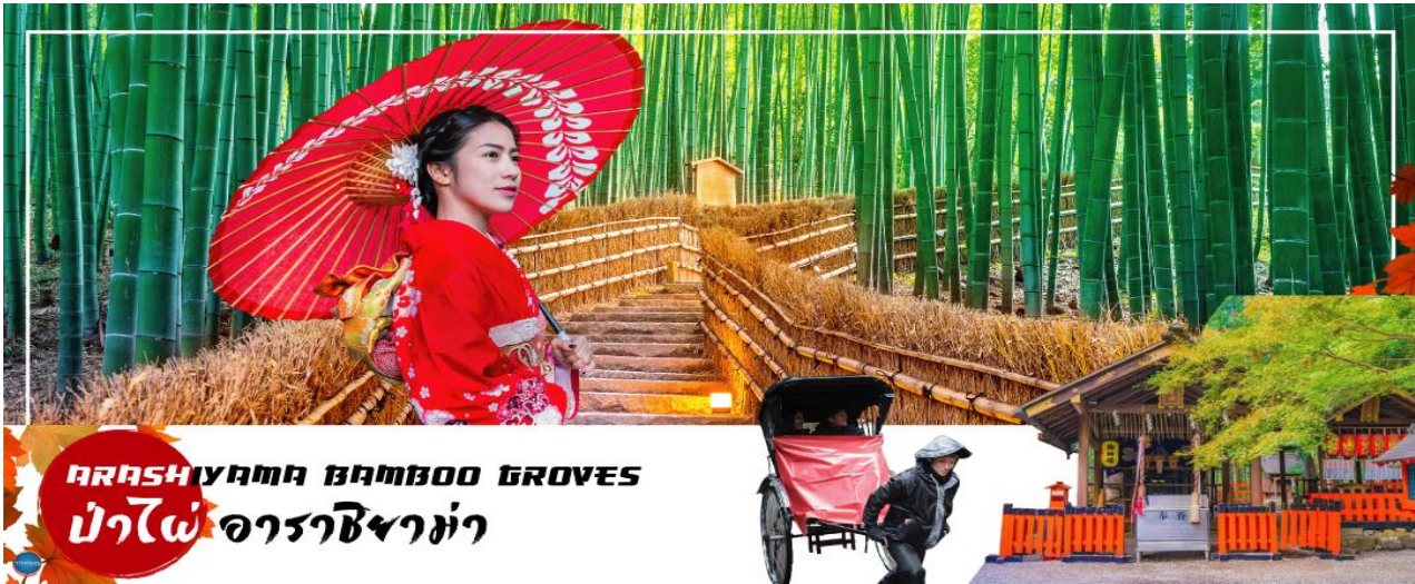
ARASHIYAMA BAMBOO GROVES ป่าไผ่ อาราชิม่า

วันที่สอง ท่าอากาศยานนานาชาติคันไซ โอซาก้า – เมืองเกียวโต – อาราชิม่า – สวนป่าไผ่ – สะพานโทเก็ตสึเคียว – เมืองโทนามิ