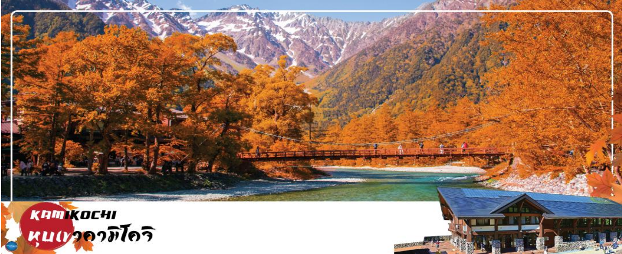
KAMIKOCHI หุบเขาคามิโคจิ

วันที่สี่ เมืองโทนามิ – จังหวัดนากาโนะ – คามิโคจิ – สะพานกัปปะ – เมืองทาคายามะ – ถนนซันมาจิซุจิ – สะพานนาคะบาชิ – ที่ทำการเก่าเมืองทาคายามะ(ด้านนอก) – เมืองนาโกย่า