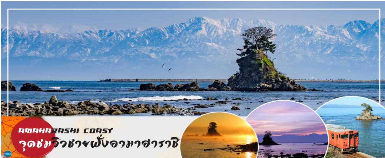
AMAHARASHI COAST จุดชมวิวยาวฝั่งอามาราชิ

จากนั้นนำท่านเดินทางกลับสู่ เมืองโทนามิ (Tonami) (ใช้เวลาเดินทางประมาณ 1.30 ชั่วโมง) เพื่อนำท่านสู่ จุดชมวิวยาวฝั่งอามาราชิ (Amaharashi Coast) สัมผัสความงดงามสุดประทับใจ