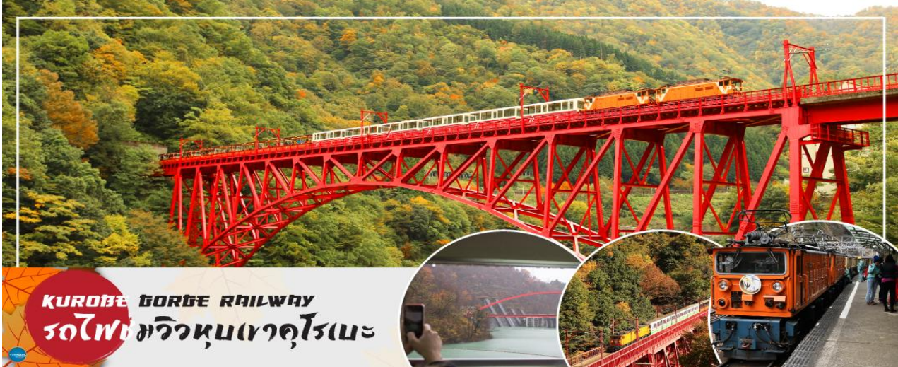
KUROBE GORGE RAILWAY รถไฟหุบเขาคุโรเบะ

วันที่สาม เมืองโทนามิ – เมืองคุโรเบะ – สถานีอุนาซึกิ – นั่งรถไฟชมวิวนหุบเขาคุโรเบะ – เมืองโทนามิ – จุดชมวิวยาวฝั่งอามาราชิ – อีออนมอลล์ โทนามิ