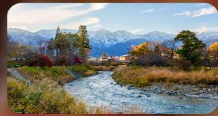
โออิเดะปาร์ค